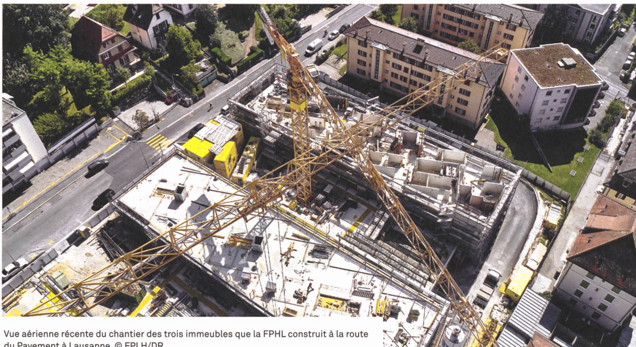
Vue aérienne récente du chantier des trois immeubles que la FPHL construit à la route du Pavement à Lausanne.

locataires sont finalement revenus. Ces 3 immeubles réalisés avec le label Minergie-P ont été mis en location en 2017 et 2018» précise M. Cardinaux. Grâce à une étroite collaboration avec la ville de Lausanne, qui est un partenaire privilégié de la FPHL, une place de jeux et des potagers communautaires ont pu être réalisés en plus de la salle de quartier et d'une salle de musique.