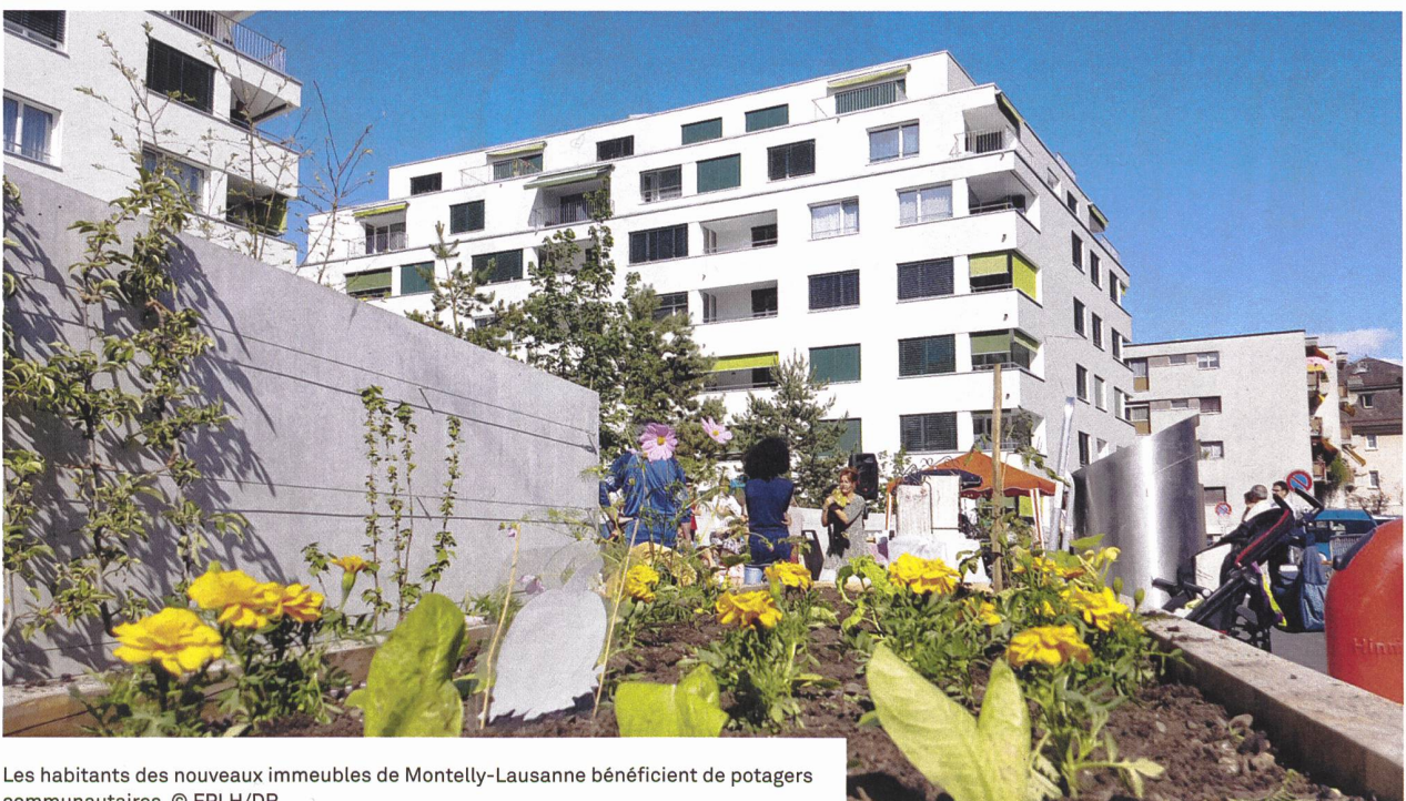
Les habitants des nouveaux immeubles de Montelly-Lausanne bénéficient de potagers communautaires.

Les trois nouveaux immeubles qui sont actuellement en construction proposeront une centaine de logements à loyer modéré. Ils seront achevés entre le dernier trimestre 2021 et le 1 er trimestre 2022. Compte tenu des subventions, les loyers devraient se situer autour de Fr. 192.–/m 2 (y compris les aides), soit pour un 3 pièces de 70 m 2 , un loyer mensuel de l'ordre de Fr. 1120.– (+ charges).