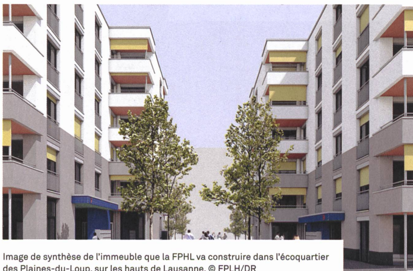
Image de synthèse de l'immeuble que la FPHL va construire dans l'écoquartier des Plaines-du-Loup, sur les hauts de Lausanne.

M. Cardinaux explique avec enthousiasme le fait que «cet immeuble sera exemplaire sur le plan de la performance énergétique, puisqu'il est développé selon la méthode sméO qui intègre toutes les thématiques du développement durable sur l'ensemble du cycle de vie du bâtiment et répondra aux standards du label Minergie-P-ECO. Les fenêtres sont en bois et métal, les murs sont en briques monolithiques de terre cuite, dans le but de réduire l'empreinte carbone. Dans les cuisines, les buanderies, les machines à laver, tout a été choisi pour économiser le maximum de courant électrique.» D'ailleurs, la ville de Lausanne donne l'exemple: des puits ont été creusés jusqu'à 800 m pour pouvoir installer des pompes à chaleur géothermiques. Des panneaux solaires seront