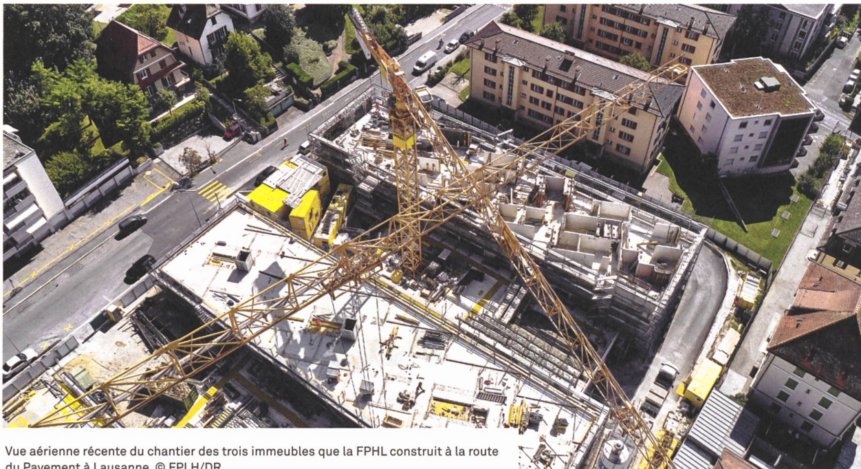
Vue aérienne récente du chantier des trois immeubles que la FPHL construit à la route du Pavement à Lausanne.

locataires sont finalement revenus. Ces 3 immeubles réalisés avec le label Minergie-P ont été mis en location en 2017 et 2018» précise M. Cardinaux. Grâce à une étroite collaboration avec la ville de Lausanne, qui est un partenaire privilégié de la FPHL, une place de jeux et des potagers communautaires ont pu être réalisés en plus de la salle de quartier et d'une salle de musique.