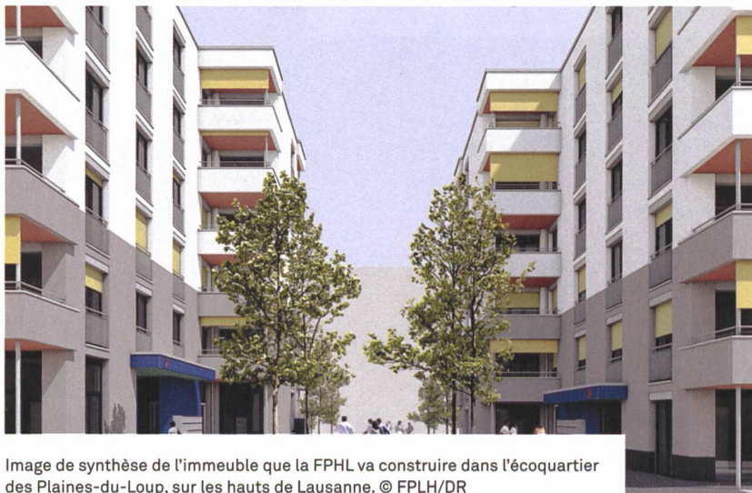
Image de synthèse de l'immeuble que la FPHL va construire dans l'écoquartier des Plaines-du-Loup, sur les hauts de Lausanne.

M. Cardinaux explique avec enthousiasme le fait que «cet immeuble sera exemplaire sur le plan de la performance énergétique, puisqu'il est développé selon la méthode sméO qui intègre toutes les thématiques du développement durable sur l'ensemble du cycle de vie du bâtiment et répondra aux standards du label Minergie-P-ECO. Les fenêtres sont en bois et métal, les murs sont en briques monolithiques de terre cuite, dans le but de réduire l'empreinte carbone. Dans les cuisines, les buanderies, les machines à laver, tout a été choisi pour économiser le maximum de courant électrique.» D'ailleurs, la ville de Lausanne donne l'exemple: des puits ont été creusés jusqu'à 800 m pour pouvoir installer des pompes à chaleur géothermiques. Des panneaux solaires seront