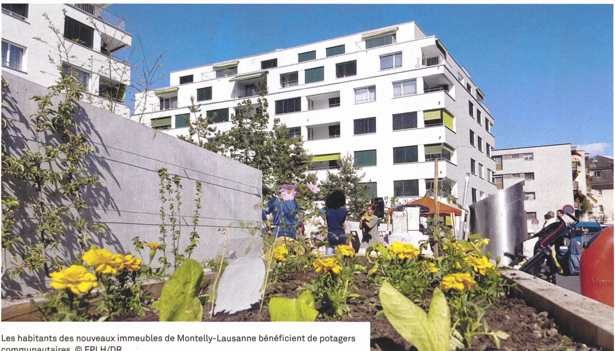
Les habitants des nouveaux immeubles de Montelly-Lausanne bénéficient de potagers communautaires.

Les trois nouveaux immeubles qui sont actuellement en construction proposeront une centaine de logements à loyer modéré. Ils seront achevés entre le dernier trimestre 2021 et le 1 er trimestre 2022. Compte tenu des subventions, les loyers devraient se situer autour de Fr. 192.–/m 2 (y compris les aides), soit pour un 3 pièces de 70 m 2 , un loyer mensuel de l'ordre de Fr. 1120.– (+ charges).