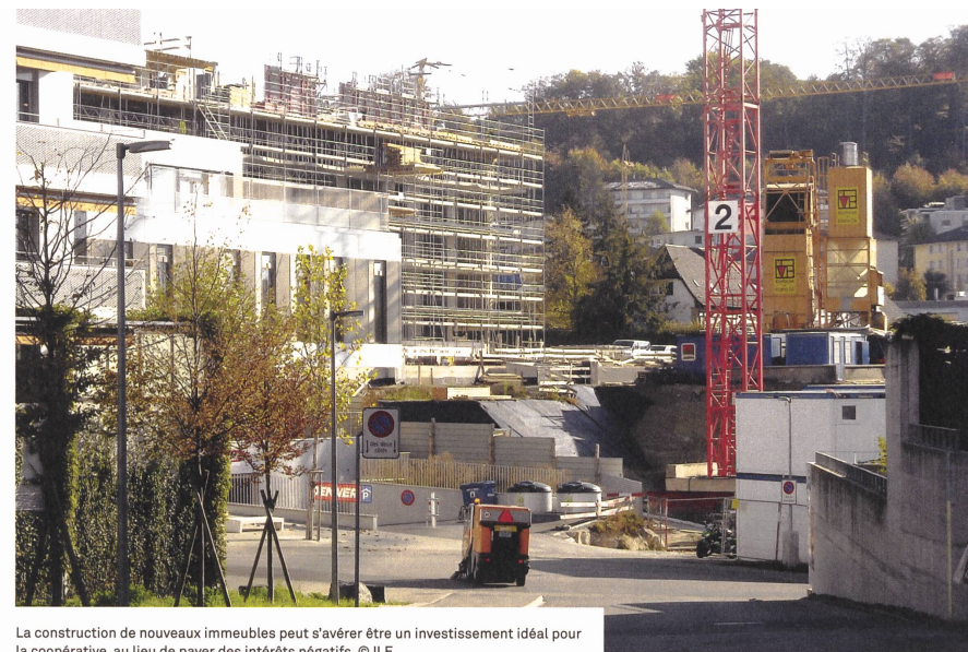
La construction de nouveaux immeubles peut s'avérer être un investissement idéal pour la coopérative, au lieu de payer des intérêts négatifs.

En principe, les coopératives sont également concernées par ces intérêts négatifs, mais ont-elles des possibilités d'éviter de les payer? Nous les avons explorées en demandant leur avis à deux présidents de coopératives d'habitation romandes: