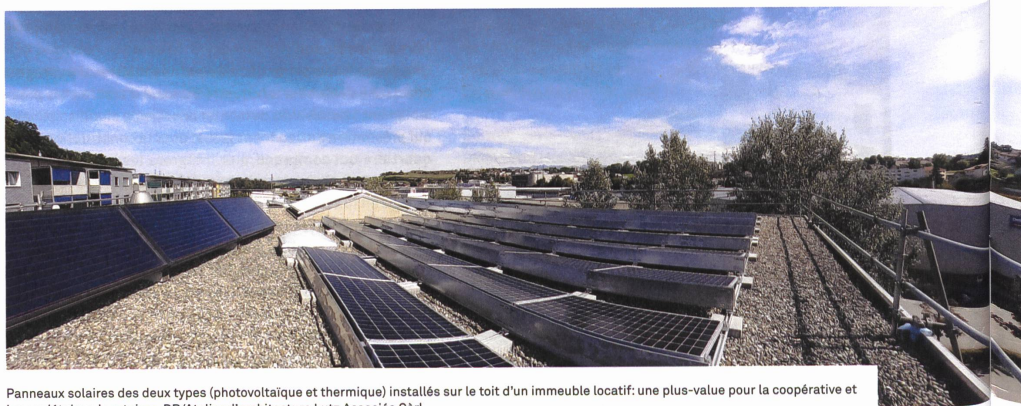
Panneaux solaires des deux types (photovoltaïque et thermique) installés sur le toit d'un immeuble locatif: une plus-value pour la coopérative et les sociétaires-locataires.

Hypothekar- Bürgschaftsgenossenschaft hbg cch Société coopérative de cautionnement hypothécaire