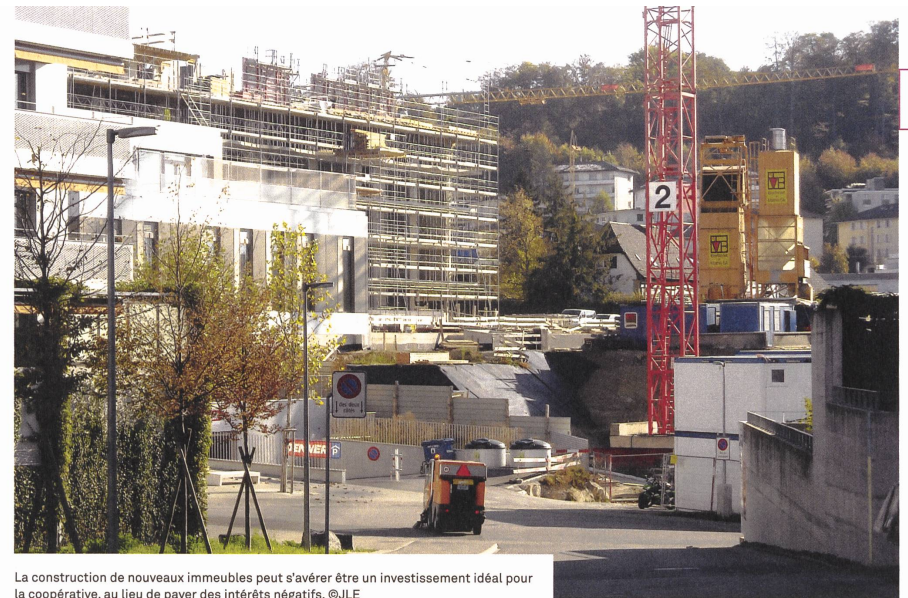
La construction de nouveaux immeubles peut s'avérer être un investissement idéal pour la coopérative, au lieu de payer des intérêts négatifs.

En principe, les coopératives sont également concernées par ces intérêts négatifs, mais ont-elles des possibilités d'éviter de les payer? Nous les avons explorées en demandant leur avis à deux présidents de coopératives d'habitation romandes: