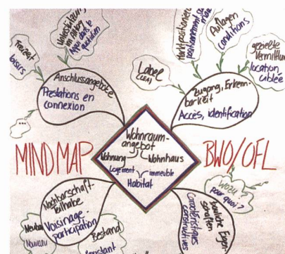
Mind map établi par l'OFL et utilisé dans le cadre de l'atelier de travail «Encouragement de l'autonomie» pour structurer les échanges.

Cette thématique concerne l'OFL en premier lieu, raison pour laquelle deux de ses collaborateurs ont animé, lors de ce colloque, un atelier placé sous le titre «Encouragement de l'autonomie». En introduction, Felix Walder et Doris Sfar ont montré à la vingtaine de participants la manière dont l'Office s'attache à promouvoir un habitat contribuant à l'intégration des personnes vivant avec un handicap. Tous les bâtiments d'habitation bénéficiant d'une aide fédérale sont tenus de respecter les conditions-cadres et l'équipement de base selon le système d'évaluation de logements (SEL). Le SEL