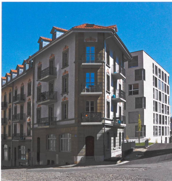
Immeubles en ville de Fribourg

Le 3 e Forum du logement se propose d'appréhender la thématique de l'adéquation entre l'offre et la demande en matière de logement sous divers angles. Outre les réflexions liées aux aspects statistiques par le biais de