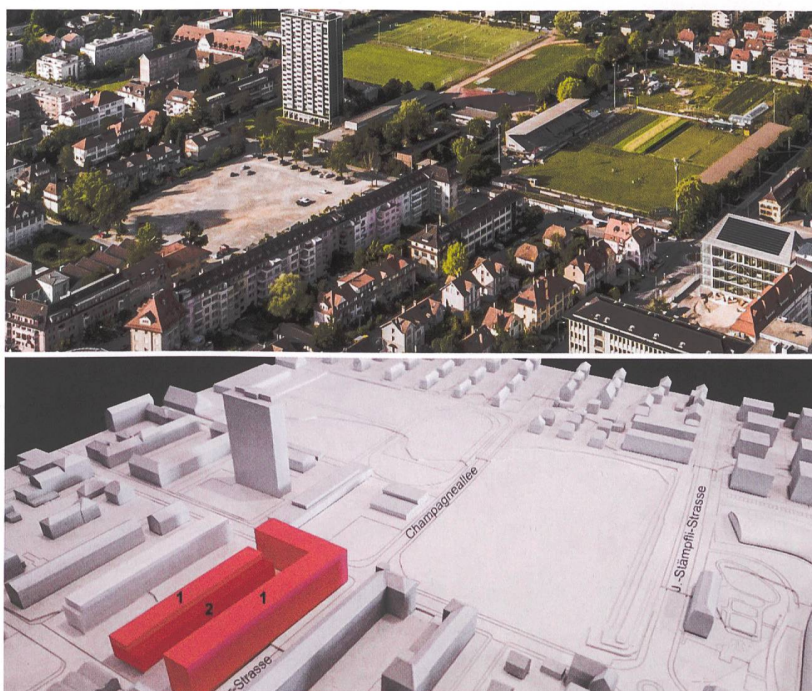
Lotissement destiné à des logements d'intérêt public (1) ainsi qu'aux ateliers de la Fondation Centre ASI (2).

En faisant la part belle aux logements d'utilité publique pour le développement du quartier de la Gurzelen, les autorités biennoises répondent à la volonté populaire (voir encadré) de ramener la part de marché immobilier des coopératives d'habitation à 20% d'ici à 2035.