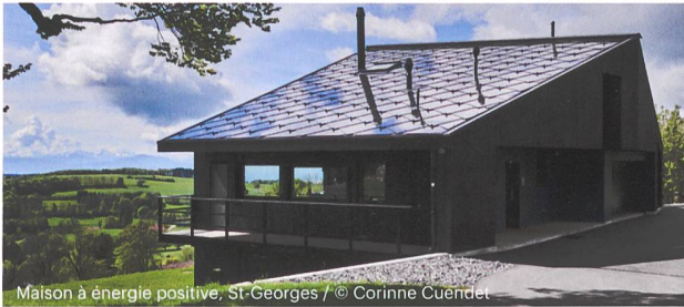
Maison à énergie positive, St-Georges