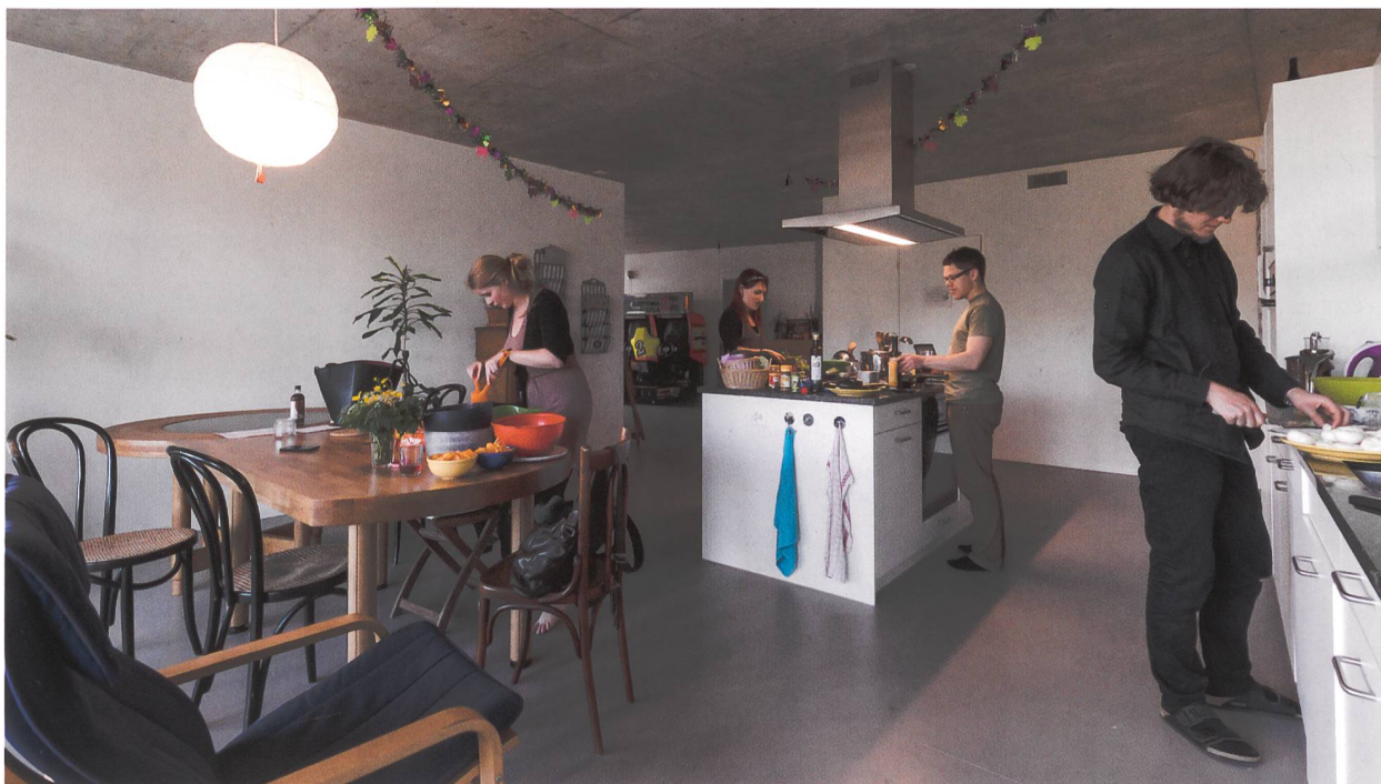
Cuisine commune dans un logement de type «cluster». Coopérative mehr als wohnen, Hunziker Areal Zurich.

Une étude menée par le Wohnforum de l'EPF-Zurich s'intéresse précisément à ces logements de taille très réduite – en Suisse, en Allemagne et en Autriche –, sous l'angle de leur offre, de leur accessibilité financière et des possibilités de vie communautaire. Pour ce faire, elle s'est penchée sur une cinquantaine de projets issus des trois pays, dont 19 en Suisse et 27 en Allemagne, pour certains encore en cours de planification. Les données ont été récoltées par le biais de recherches dans la littérature et inter-