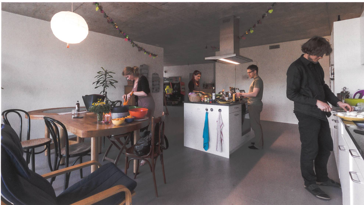
Cuisine commune dans un logement de type «cluster». Coopérative mehr als wohnen, Hunziker Areal Zurich.

Une étude menée par le Wohnforum de l'EPF-Zurich s'intéresse précisément à ces logements de taille très réduite – en Suisse, en Allemagne et en Autriche –, sous l'angle de leur offre, de leur accessibilité financière et des possibilités de vie communautaire. Pour ce faire, elle s'est penchée sur une cinquantaine de projets issus des trois pays, dont 19 en Suisse et 27 en Allemagne, pour certains encore en cours de planification. Les données ont été récoltées par le biais de recherches dans la littérature et inter-