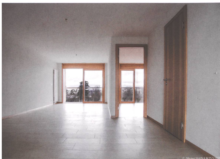
Les typologies privilégient les 2, 3 et 4 pièce.