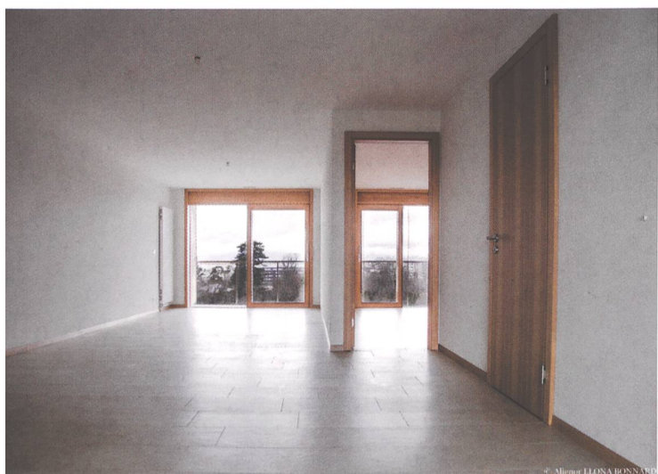
Les typologies privilégient les 2, 3 et 4 pièces.