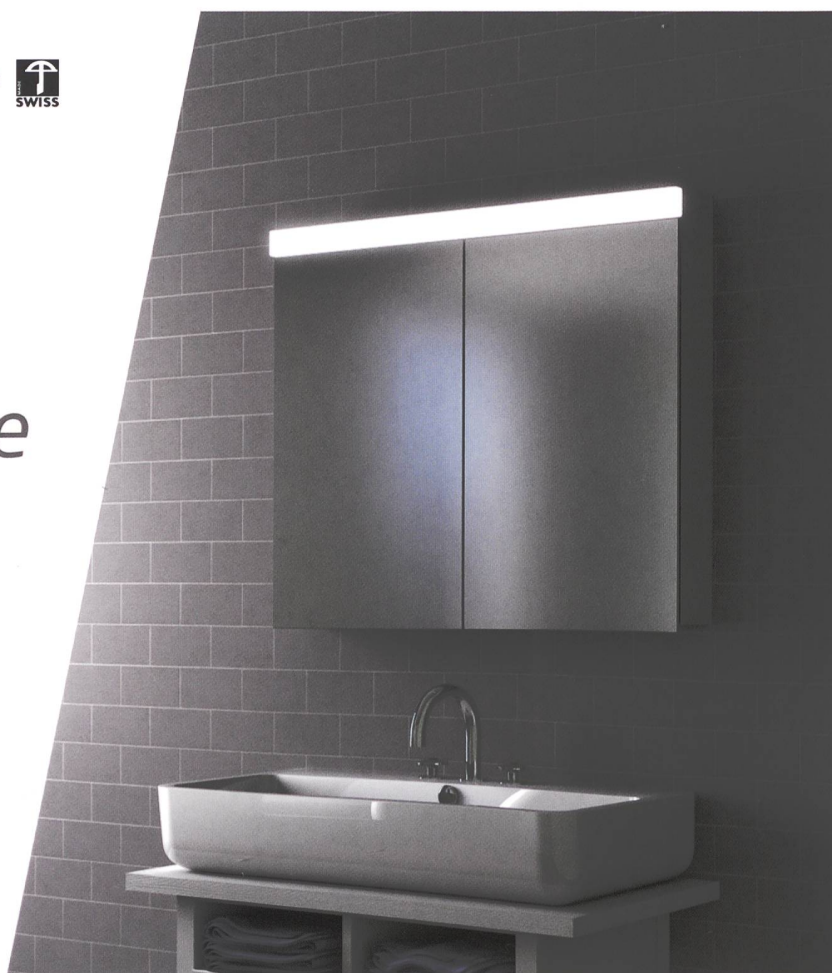
modèle Duplex New LED