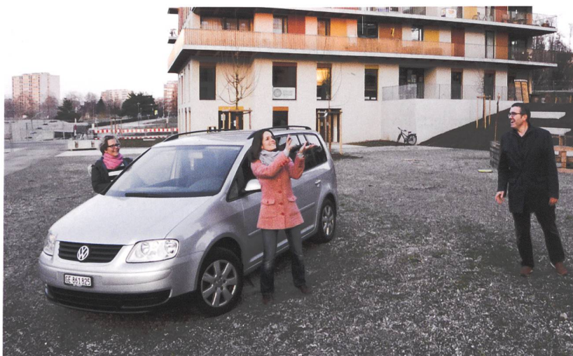
Se passer les clés de la voiture en autopartage: un vrai plaisir!

rait-elle pas de quelques voitures que les locataires pourraient utiliser en cas de besoin? Le principe ayant été accepté, il restait à mettre en place le système pour qu'il réponde aux attentes des futurs utilisateurs!