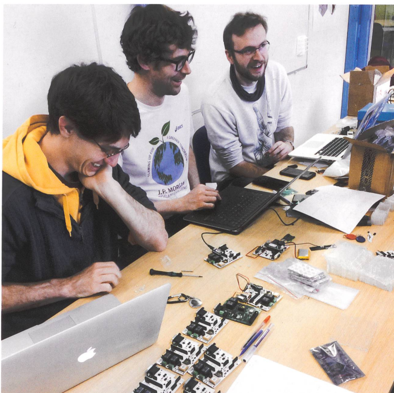
Le groupe des initiateurs du projet Comobilis.org en plein travail!

En Romandie, cinq immeubles existent sans ou avec très peu de voitures: situés dans les quartiers de Cressy, Soubeyran et Vergers, à Genève, ils ont été inaugurés en 2011, 2017 et 2018, et disposent de quelques places de parc pour l'autopartage. Vous avez dit «autopartage»? Tout a commencé dès les premières discussions entre les futurs coopérateurs-locataires de la coopérative Equilibre pour définir le premier projet immobilier à Cressy. La plupart d'entre eux n'avaient pas de voiture privée et ceux qui en avaient une étaient prêts à s'en séparer. Il a donc été décidé que les contrats de bail de la coopérative Equilibre incluraient une clause de renonciation à la voiture privée. Avec l'attribution de l'appartement, les coopérateurs s'engagent à abandonner leur voiture privée. Mais que faire pour tout de même disposer d'une voiture en cas de besoin (pour se rendre dans un endroit difficile d'accès en transports publics, ou pour un week-end ou une semaine de vacances avec les enfants)? Une idée a alors germé: pourquoi la coopérative ne dispose-