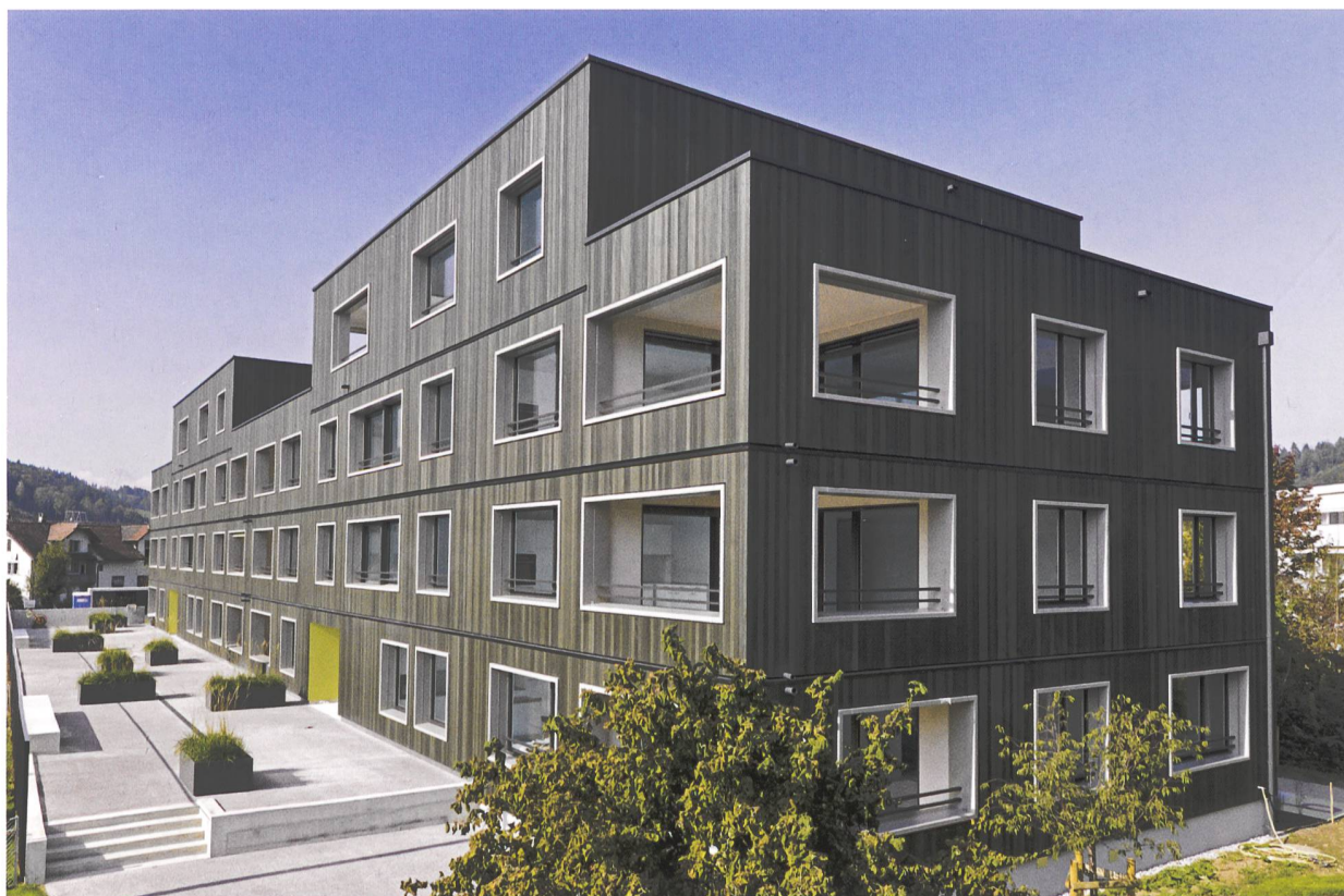
Il est maintenant possible de construire des immeubles locatifs entièrement en bois, à l'exemple de la Swisswoodhaus à Nebikon.

bois est une matière première naturelle et noble, et elle est disponible sur place grâce à l'exploitation contrôlée de nos forêts. Que toute coopérative d'habitation qui aimerait mieux connaître les possibilités de l'utilisation du bois dans son projet d'un immeuble locatif nous contacte sans hésiter!»