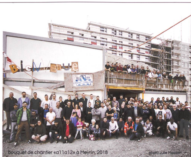
bouquet de chantier «a11a12» à Meyrin, 2018