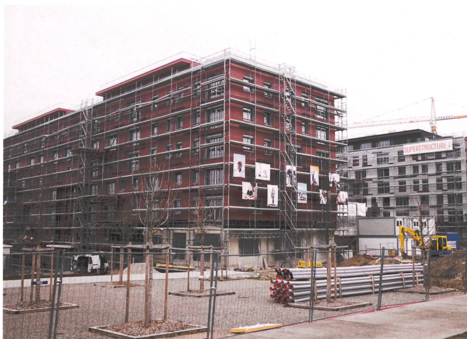
Pour ce bâtiment hybride (Les Vergers à Meyrin), la structure porteuse est en béton et les éléments de façade sont à ossature bois, de même que les attiques. © Bellmann, bureau d'architectes, Montreux

La demande d'informations sur l'intégration du bois dans les constructions est croissante, indique M. Sébastien Droz de Lignum, Economie suisse du bois: «Les demandes concernent souvent l'utilisation du bois pour des petits locatifs et des immeubles de grandeur moyenne. Le