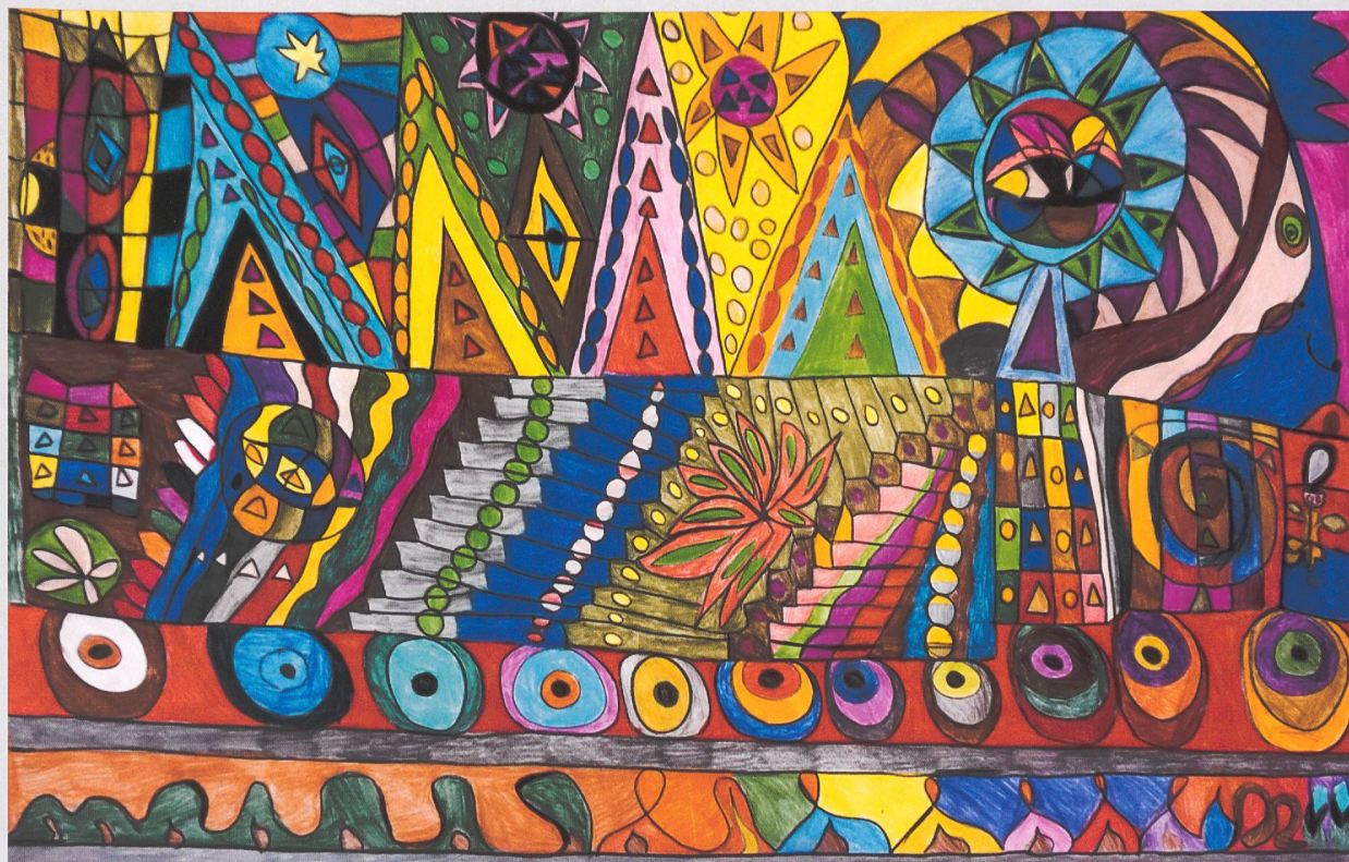
Le camion de Nice, 50x70, 2017 © CREAHM