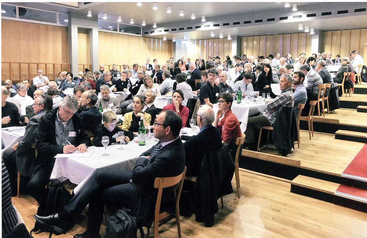
Un public de près de 200 personnes.

Yvonne Seiler-Zimmermann, IFZ-HSLU, a quant à elle présenté les conclusions d'une étude sur la possibilité pour les locataires de devenir propriétaires temporaires de leur habitat. Une piste que Fritz Freuler trouve plutôt vaine, arguant lors des échanges publics du jour, que les coopératives avaient depuis longtemps déjà trouvé une alternative à la propriété individuelle pure et dure dans le mode de propriété collective établie par les coopératives d'habitation – la fameuse troisième voie du logement, entre propriété et location.