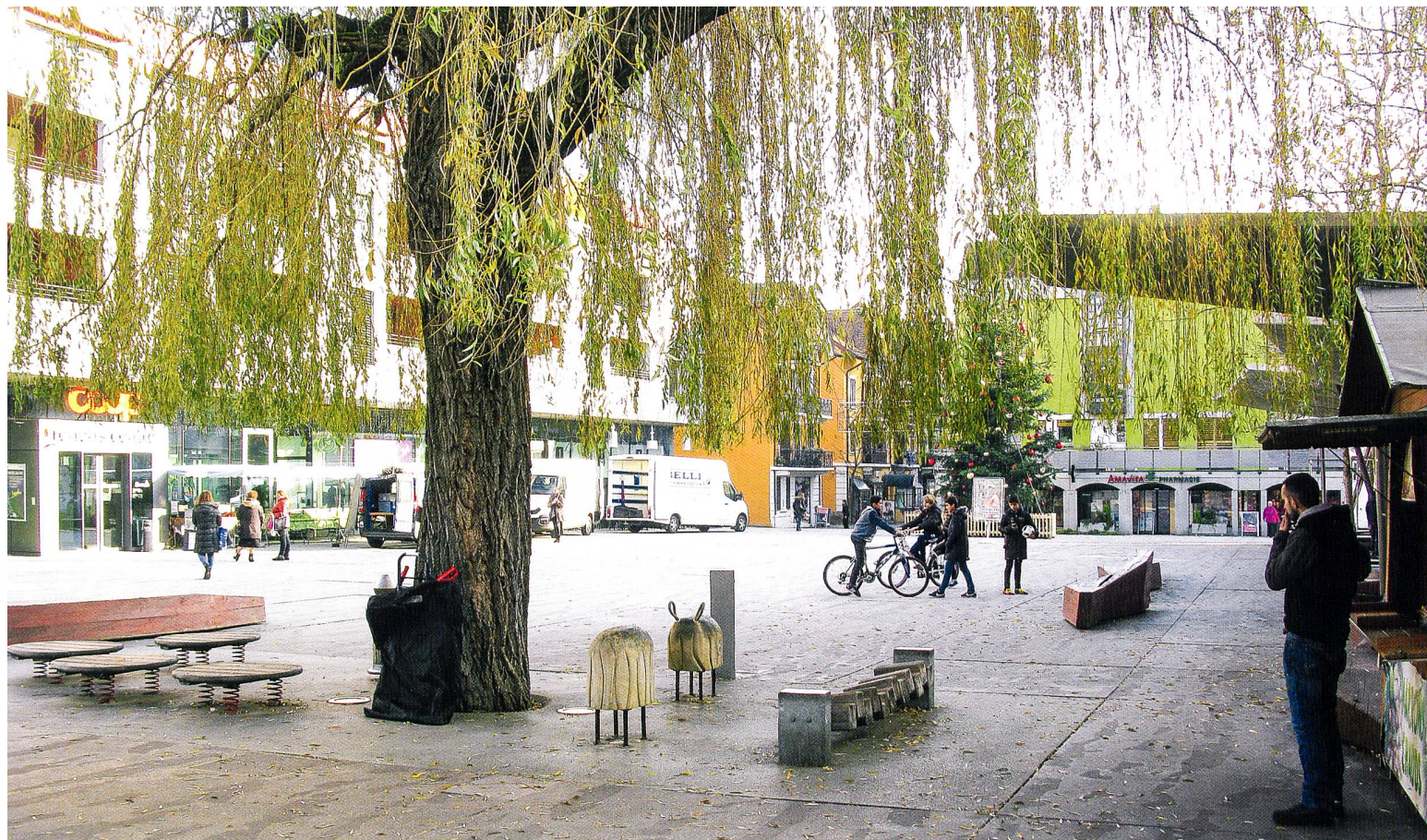
La place du Marché de Renens a fait l'objet d'un réaménagement complet. Désormais, elle invite à la détente et à la convivialité.