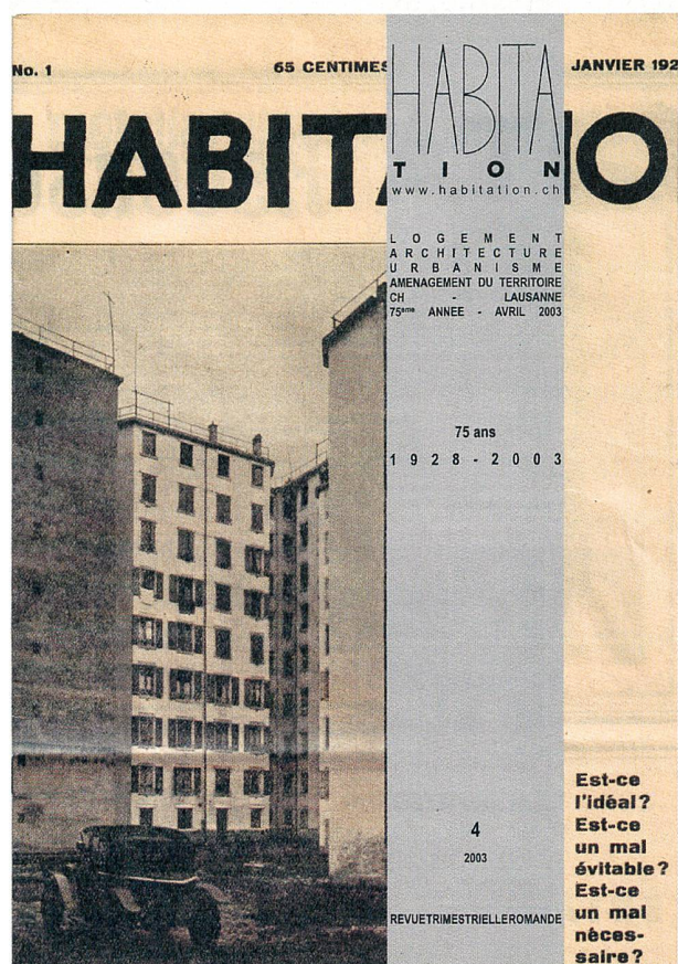
Couverture de Habitation 4/2003, 75 ans (1928-2003) de la revue.

Les préoccupations des trois organisations devenant toujours plus spécifiques, elles se retrouvent à deux après le départ de l'ASPAN. En 2000, c'est la FAS qui quittera la revue pour publier ses propres documents. Mais Habitation reste l'organe officiel des Sociétés coopératives d'habitation affiliées à l'USAL (section romande de l'USAL). En 1990, on y ajoute la mention des «maîtres d'ouvrage d'utilité publique». Pour ses 75 ans, l'USAL change de nom et devient l'Association suisse pour l'habitat – ASH). Le N° 4-2003 fête les 75 ans de la revue, qui devient une «revue trimestrielle romande». Une société d'édition (Socomhas, Société coopérative de communication de l'habitat social) est créée pour gérer la revue. Enfin, le 1 er janvier 2013, l'ASH section romande devient l'ARMOUP.