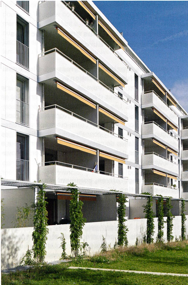
Le quartier de Maillefer.

Ainsi, pour prendre l'exemple de la SCHL dont j'ai été le directeur pendant 22 années, elle remboursait immédiatement les parts sociales aux locataires partants. Le délai de remboursement doit être fixé dans les statuts de la coopérative, afin d'éviter tout problème. Le remboursement peut être problématique si les parts sociales liées à un logement représentent un montant élevé.