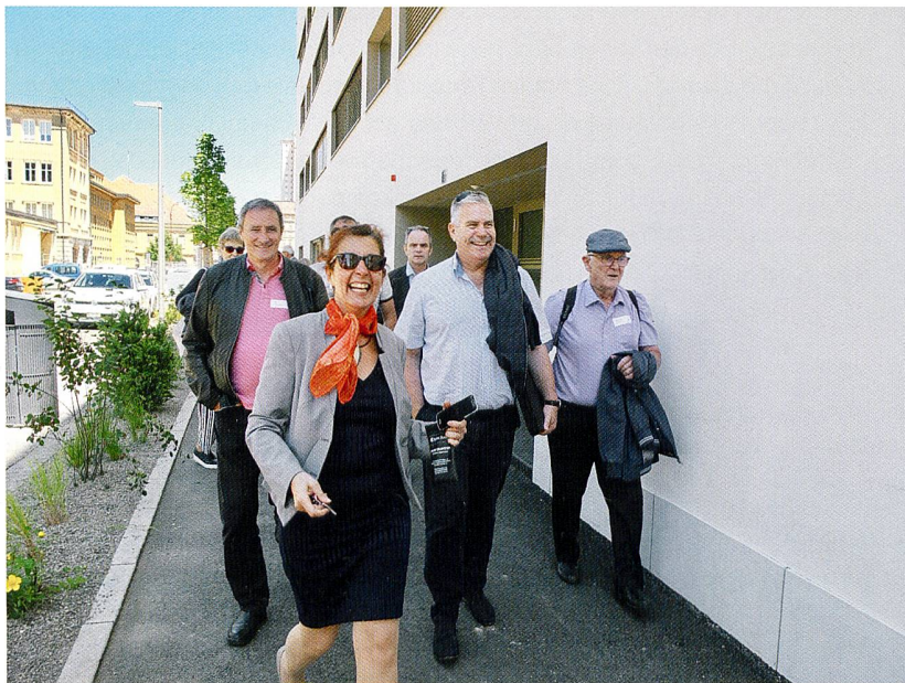
L'ARMOUP visite l'écoquartier Le Corbusier après son AG.

Le plan spécial du quartier Le Corbusier a été reconnu par l'ARE (Office fédéral du développement territorial) en tant que «projet modèle de quartier durable» grâce à sa triple mixité: sociale, intergénérationnelle et fonctionnelle. En effet, ce quartier est notamment caractérisé par la mixité des logements proposés. On y compte 19 appartements protégés (labellisés «avec encadrement» mais ce ne sont pas des «LUP» dédiés aux personnes âgées, 12 appartements en PPE, et 36 logements «LUP» de la Coopérative. Sur ce même site a été construit un immeuble pour l'Office cantonal d'assurance-invalidité (AI) du canton ainsi que pour l'ORIF (une institution cantonale spécialisée dans l'intégration et la formation des assurés bénéficiant de l'AI). C'est en mars 2014 que les travaux ont débuté. Et les premiers locataires ont pu emménager dès le