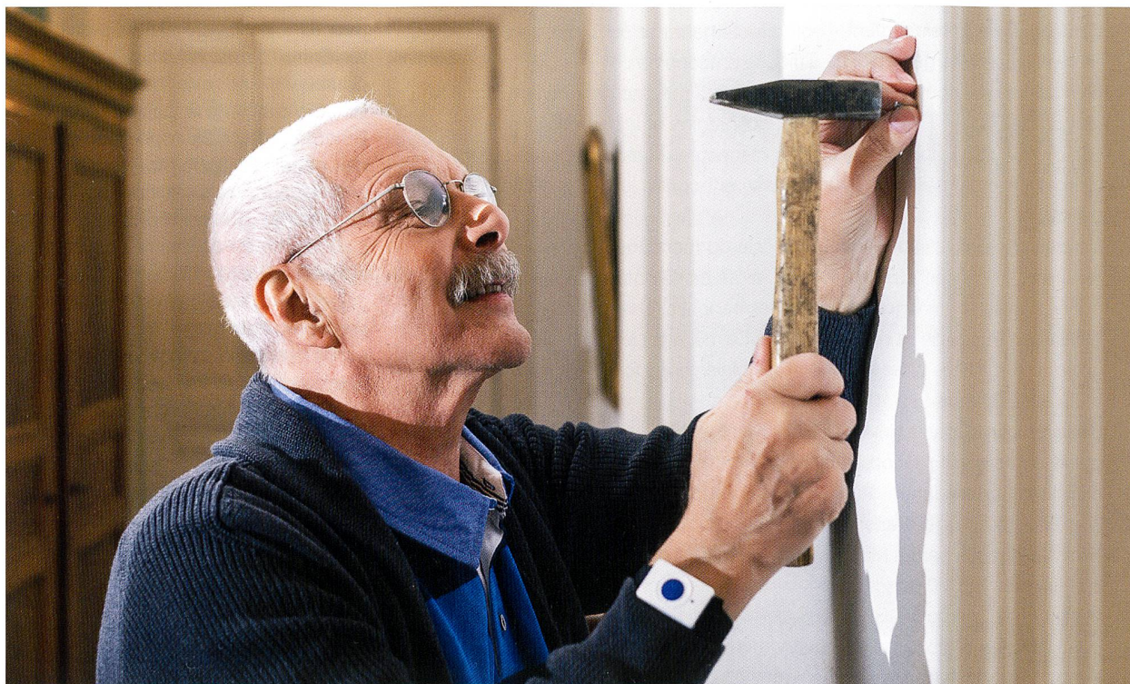
Le bracelet-alarme que l'on met au poignet est à la fois très sécurisant et très pratique (modèle de SmartLife-Care).

Commençons par la porte d'entrée de l'immeuble. Quelqu'un sonne à l'entrée de l'immeuble en utilisant l'interphone. Qui est-ce? Plutôt que de presser la touche d'ouverture de la porte sans savoir qui a sonné en bas, on regarde l'écran installé chez soi qui montre ce que la caméra filme à l'entrée. On voit qui a sonné, et on est rassuré (ou non). Un autre système est celui qui transmet