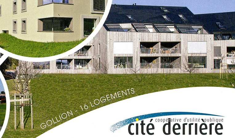
GOLLION - 16 LOGEMENTS

Membre Armoup association romande des maîtres d'ouvrage d'utilité publique