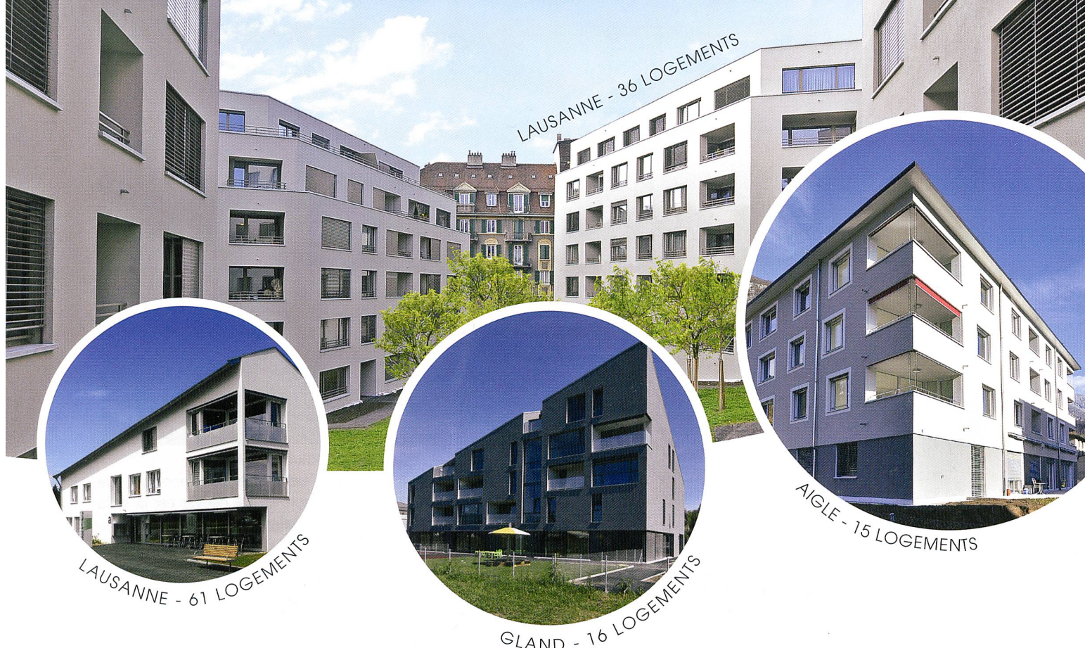
LAUSANNE - 36 LOGEMENTS