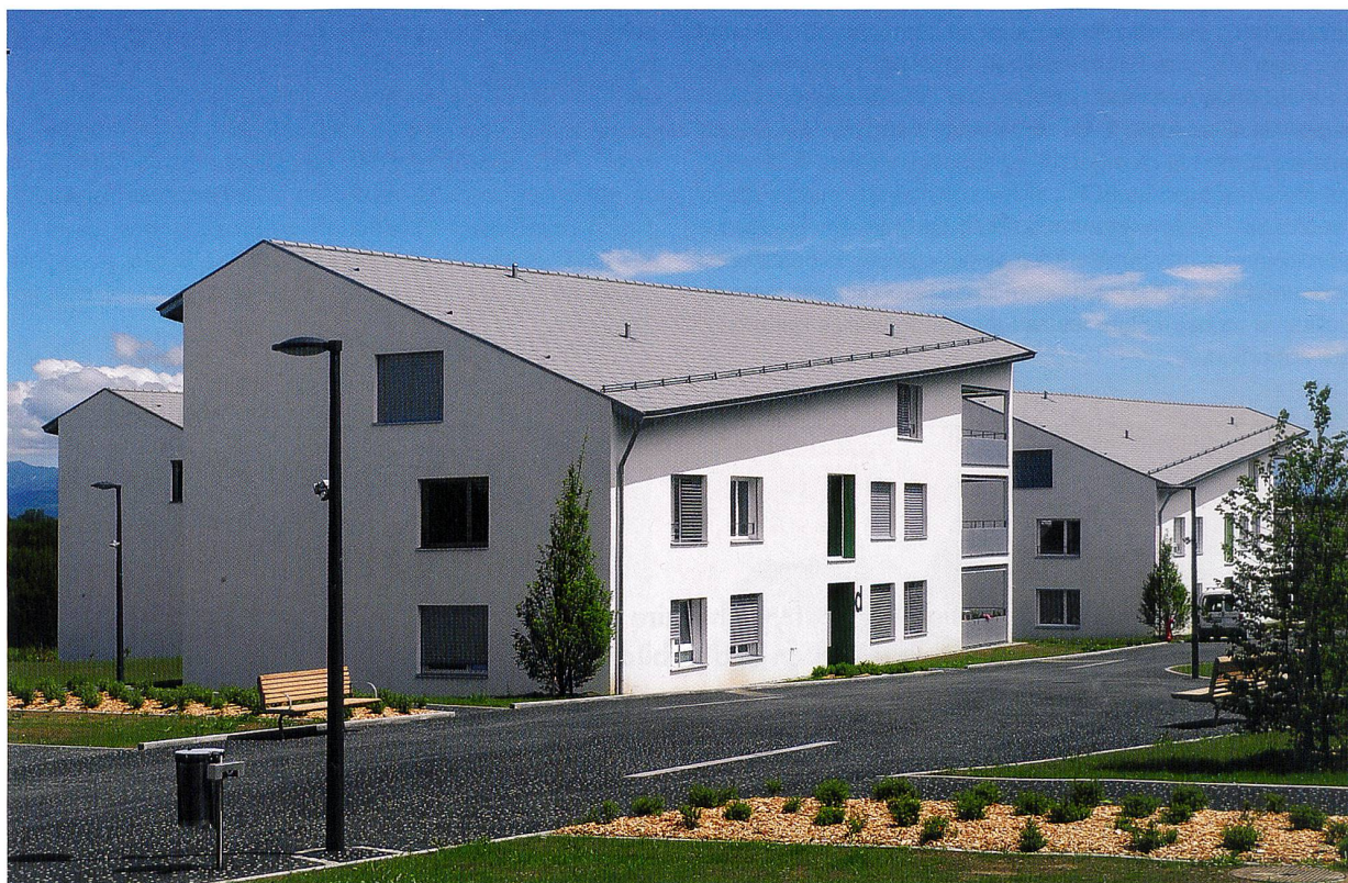
Site de Pra Roman (Vers-chez-les Blancs, Lausanne).

tous les domaines, ait déjà donné une définition officielle de ce qu'est un «logement protégé». Eh bien non! Selon M. Diesbach, «le terme est mal choisi, car cette notion n'est pas protégée officiellement. Donc chacun y va un peu de sa petite définition personnelle!» En effet, jusqu'à ce jour, s'agissant du canton de Vaud, celui-ci ne s'est pas encore doté d'une planification pour les logements protégés comme il l'a fait pour les EMS (établissements médico-sociaux) et les CMS (centres médicaux sociaux pour les soins à domicile). Précisons tout de même ici que si le propriétaire d'un immeuble respecte les conditions définies par le SASH (Service des assurances sociales et de l'héberge-