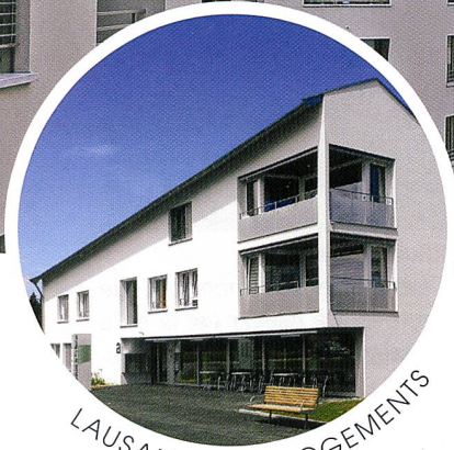
LAUSANNE - 61 LOGEMENTS