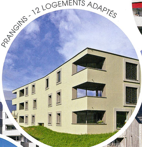
PRANGINS - 12 LOGEMENTS ADAPTÉS