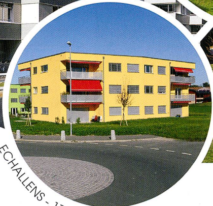
ECHALLENS - 17 LOGEMENTS