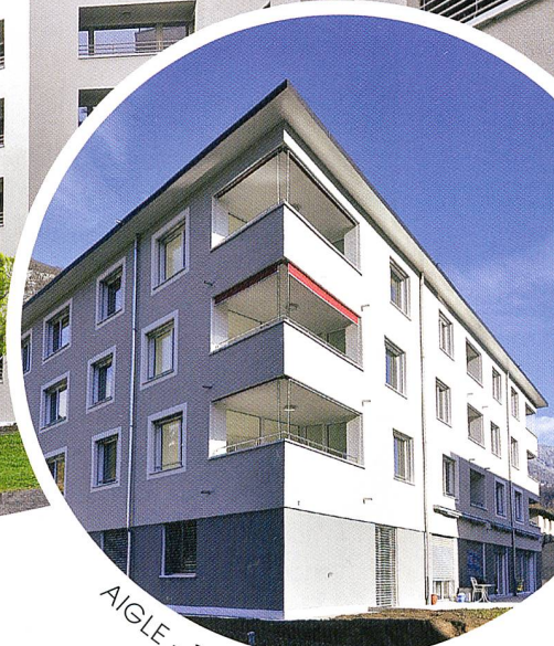
AIGLE - 15 LOGEMENTS

LE LOGEMENT PROTÉGÉ : VOTRE DEMANDE, NOTRE RÉPONSE ! RÉFÉRENCE, EXPÉRIENCE, COMPÉTENCE, NOTRE COOPÉRATIVE EST VOTRE ALTERNATIVE.