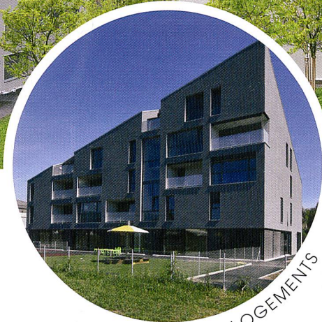
GLAND - 16 LOGEMENTS