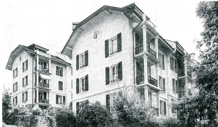
La Maison ouvrière au chemin des Bégonias après les rénovations de 1988.

Retour à Lausanne, où la future Société coopérative de Lausanne (SCHL) est appelée de ses vœux par des membres de l'Union locale du personnel fédéral (ULPF). En 1920, le tribun socialiste genevois Léon Nicole est invité à présenter la toute neuve SCHG. Un municipal lausannois, Arthur Freymond, complète l'affiche. Un comité d'initiative se forme dans la foulée. Des pourparlers sont engagés avec la municipalité, ils sont récompensés par un terrain à Prélaz, qui doit permettre la réalisation de 57 logements minimum. Le modèle de la cité-jardin est alors plébiscité. 200 personnes assistent à l'assemblée générale de 1920. Les statuts mentionnent «La rareté des logements vacants à Lausanne, due à l'arrêt presque complet de la construction de maisons d'habitation, engendre une hausse continue des loyers et menace de devenir un vrai danger pour l'ensemble de la population.»