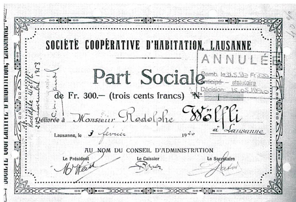
Part sociale de la SCHL en 1920.

La chronique de grandes et anciennes coopératives romandes rappelle à quel point l'environnement et la mission varient peu. Instituts de crédits hésitants, pouvoir publics inquiets. Et quantité de ménages et de personnes seules laissées à l'écart du marché (libre) du logement.