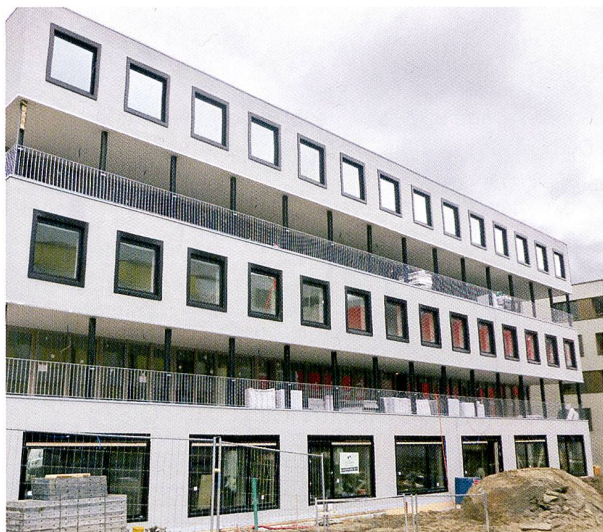
La Ciguë.

Deux des immeubles de la Fondation Nouveau Meyrin sont habités, l'un depuis juillet, l'autre depuis décembre 2017. Selon le programme, Le Niton devrait suivre ce printemps, Les Ailes dès juin, La Codha et Voisinage