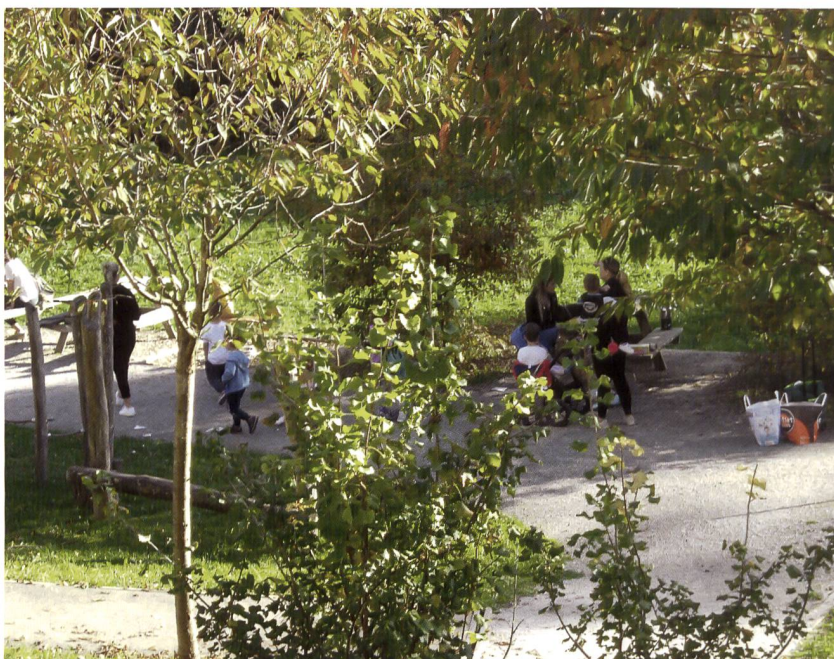
La place de jeux est très prisée des enfants. Des tables et bancs permettent de faire de joyeux pique-niques!

Mais, avant que la pose de la première pierre ne puisse se faire, bien des étapes ont dû être franchies et des obstacles surmontés. Un plan de quartier a été élaboré pour la partie du Mont-sur-Lausanne de la parcelle. La