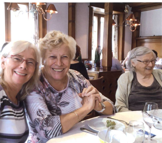
Les activités organisées pour les résidentes de mixAGE sont nombreuses. Lors de la brisolee de l'automne passé, le bonheur était au rendez-vous!

senior peut aussi s'adresser à l'étudiant de son étage pour rédiger et taper une lettre. Enfin, mentionnons que quelques logements de 2½ et 3½ pièces sont loués à des familles et que le bâtiment bénéficie de prêts hypothécaires à taux réduit de l'Etat de Vaud et de fonds issus de la LOG (fonds de roulement et CCL).