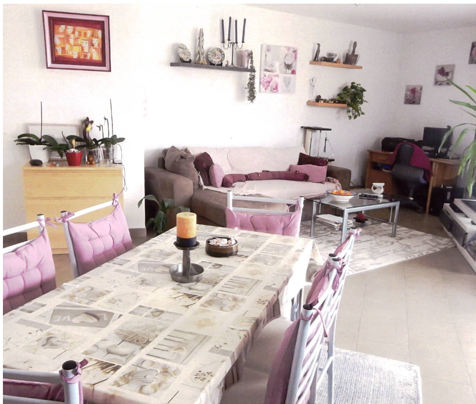
Les chambres des résidents sont à la fois spacieuses et claires.