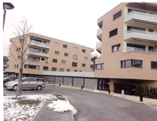
Les deux bâtiments de mixAGE sont situés à la rue de la Vernie à Crissier.

L'isolement social étant un facteur prépondérant de fragilisation, le projet mixAGE a réalisé un ensemble de logements sécurisés et adaptés, des