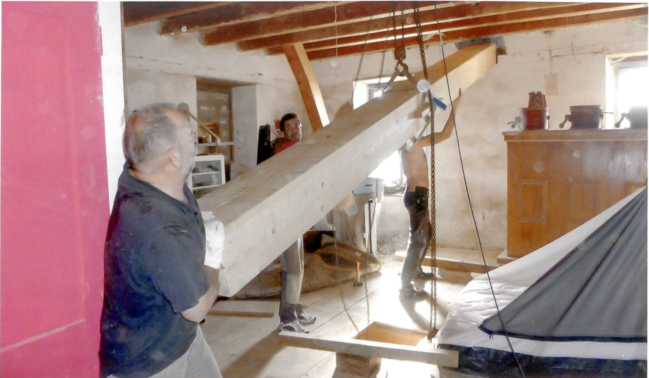
Les joies de l'autoconstruction: renforcement de la structure du moulin.

pris connaissance de l'existence des différents outils de financement de la Confédération – le Fonds de roulement, le fonds de solidarité, la CCL, la CCH... Mais il faut bien comprendre que ces outils n'ont pas le même champ d'action. La CCL par exemple ne concerne que la consolidation à la fin de la construction. Les critères d'octroi des uns ou des autres ne sont pas les mêmes. Je leur fais aussi part de mes expériences personnelles, je leur présente des cas concrets: il faut bien insister sur l'importance des fonds propres, et surtout sur la question de la viabilité à long terme du projet. Il faut que les porteurs de projet gardent les pieds sur terre!»