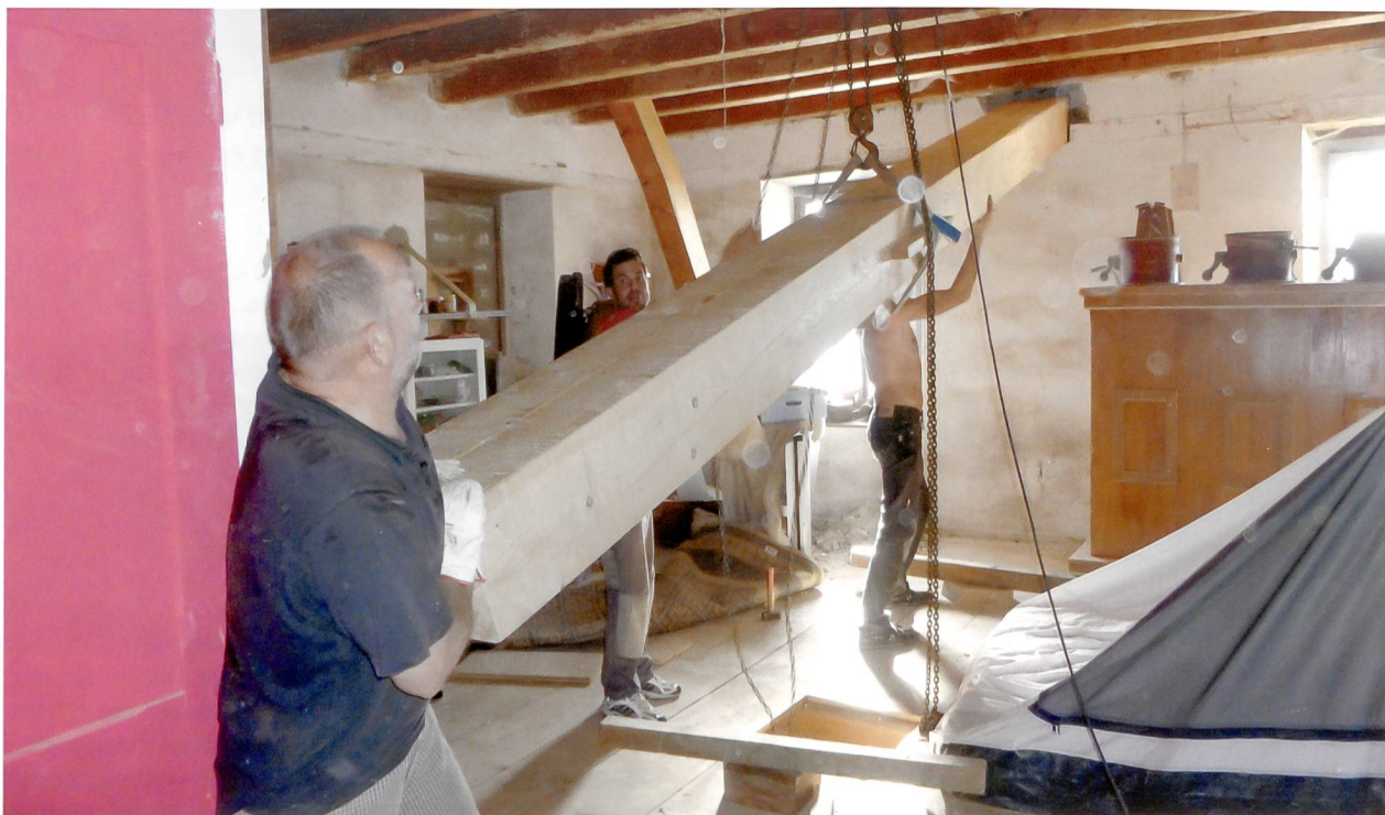
Les joies de l'autoconstruction: renforcement de la structure du moulin.

pris connaissance de l'existence des différents outils de financement de la Confédération – le Fonds de roulement, le fonds de solidarité, la CCL, la CCH... Mais il faut bien comprendre que ces outils n'ont pas le même champ d'action. La CCL par exemple ne concerne que la consolidation à la fin de la construction. Les critères d'octroi des uns ou des autres ne sont pas les mêmes. Je leur fais aussi part de mes expériences personnelles, je leur présente des cas concrets: il faut bien insister sur l'importance des fonds propres, et surtout sur la question de la viabilité à long terme du projet. Il faut que les porteurs de projet gardent les pieds sur terre!»