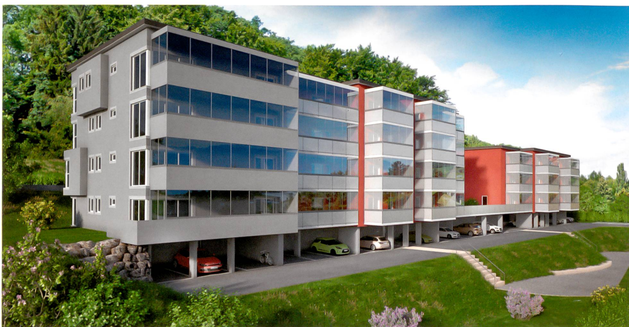
Perché dans le Lavaux, Les Brûlées offriront 28 appartements supplémentaires à la coopérative. A gauche, 4 appartements en PPE développé par un propriétaire privé. ©Atelier d'architecture Christian Moriggi/DR

La CLL n'a en rien participé à la construction du deuxième bâtiment, où elle dispose, depuis 2006, de huit appartements, aux Moulins – encore à