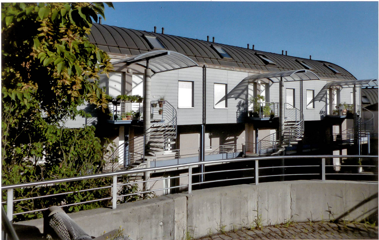
Le complexe des Champs, la première réalisation, menée en collaboration avec la commune et un promoteur.

Pour cette construction, la CLL a mis sur pied une commission tech-