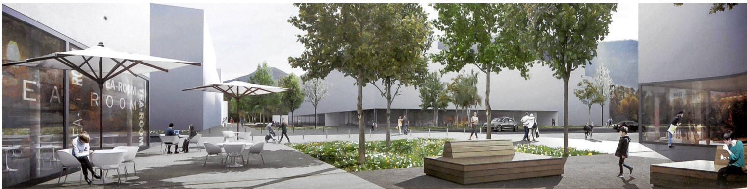
Projet pilote sur le secteur Prailles-Acacias-Vernets (PAV), des coopératives seront chargées de piloter un processus participatif, en vue de construire sur une parcelle, conjointement avec des promoteurs.

cite encore de fortes résistances). Dès lors, il a été décidé de définir des périmètres et d'offrir ainsi un cadre pour permettre aux coopératives de discuter avec les propriétaires de villas. Selon le rapport GCHG/Urbamonde, les coopératives sont mieux perçues que l'Etat ou les promoteurs traditionnels. Elles devraient donc être plus facilement écoutées. Leur approche participative, nullement spéculative, pourrait leur permettre de vaincre les réticences de propriétaires, et de les intégrer aux projets (lire aussi encadré). C'est un outil pour dégager des terrains que nous allons expérimenter. Mais sans être naïfs, car nous sommes conscients qu'il s'agit d'une population qui habite parfois des villas situées au centre-ville, et qui n'a pas envie d'en changer.