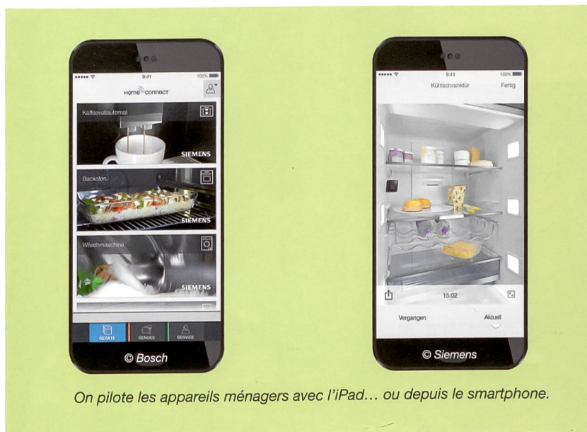
On pilote les appareils ménagers avec l'iPad... ou depuis le smartphone.