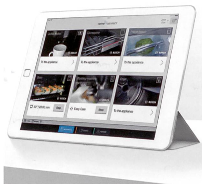
Le selfie de votre frigo.

informé quand vous devrez intervenir vous-même durant la cuisson. Avec, à la clé, un rôti digitalisé vraiment plus tendre et gouteux?