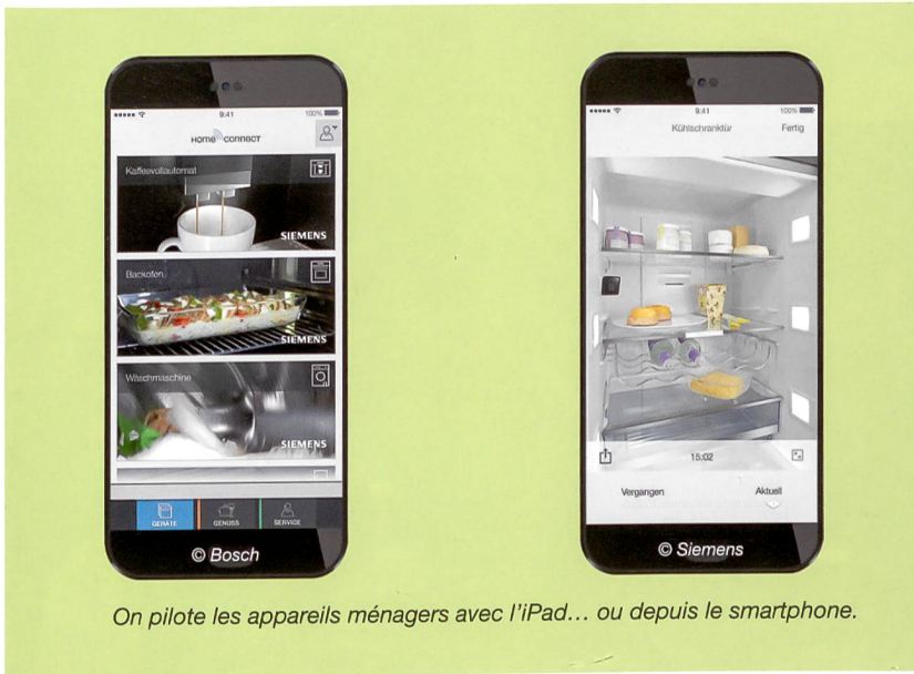
On pilote les appareils ménagers avec l'iPad... ou depuis le smartphone.