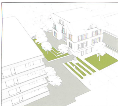
Les aménagements extérieurs jouent avec les différences de niveaux.