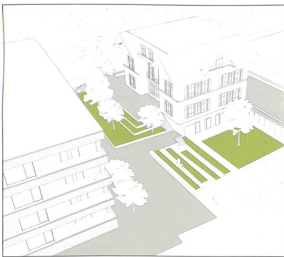
Les aménagements extérieurs jouent avec les différences de niveaux.