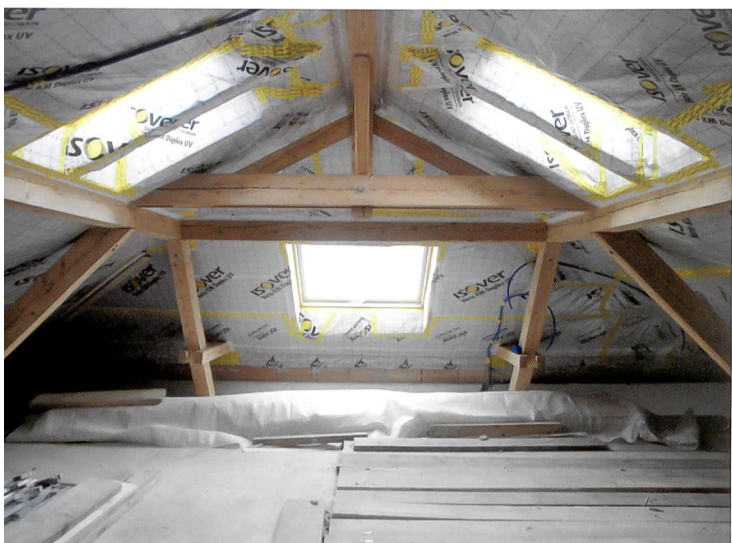
Les panneaux d'isolation sont fixés sous la charpente. © Lutz Architectes, Givisiez