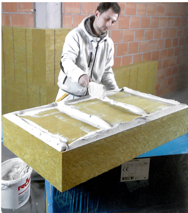
Préparation de la surface du panneau avec de la colle spéciale.