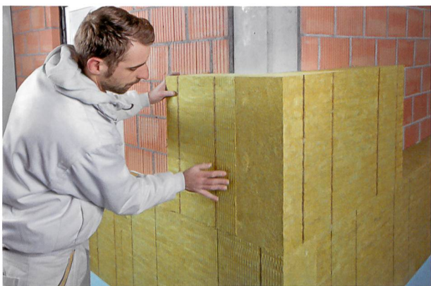
Pose des panneaux d'isolation contre un mur extérieur.