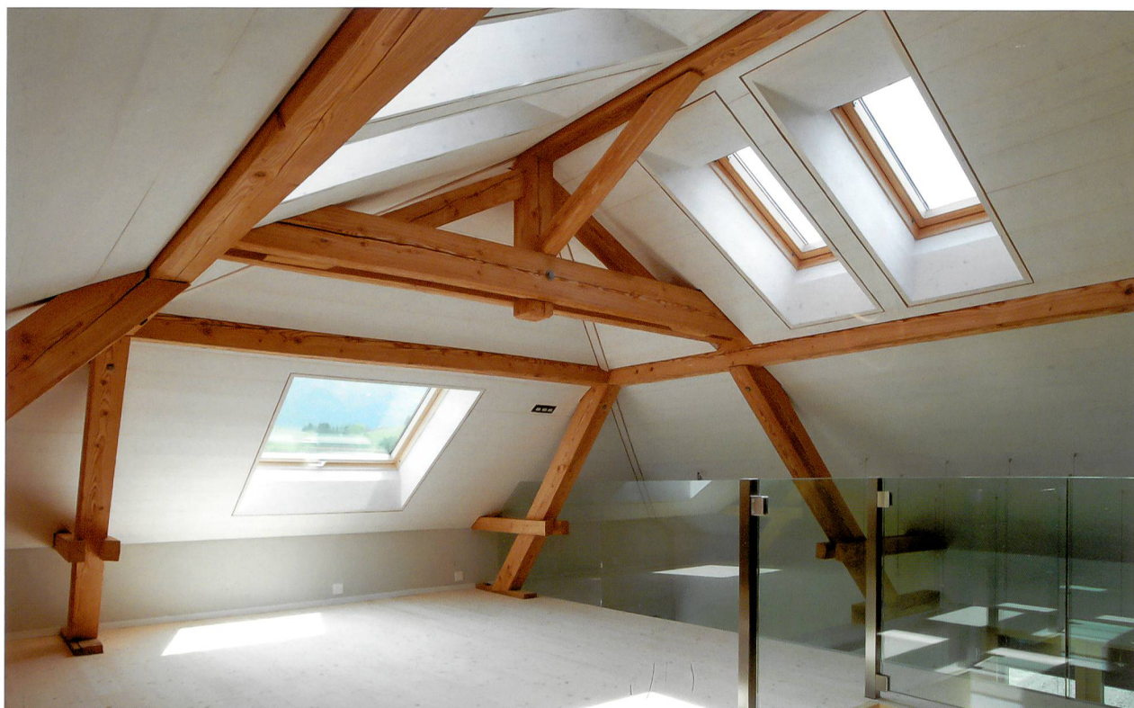
Les combles de cette maison ont été entièrement isolés. © Lutz Architectes, Givisiez

Bien que considérés comme les meilleurs isolants au monde, les aérogels à base de silice seule sont cassants et ont tendance à former de la poussière. Avec le développement d'un aérogel hybride utilisant des biopolymères, des chercheurs du Laboratoire fédéral d'essai des matériaux et de recherche (EMPA, Thoune, www.empa.ch ) ont éliminé ces inconvénients tout en conservant à ce matériau poreux ultraléger ses extraordinaires propriétés isolantes. En collaboration avec l'entreprise suisse Fixit SA, les scientifiques ont atteint simultanément trois buts: cet aérogel hybride est mécaniquement robuste, il est ultra isolant et sa fabrication écologique (avec une solution aqueuse) ne demande que des matières premières biologiques et minérales (silice et pectine – que l'on trouve dans les pommes). De plus, ce produit diminue fortement la formation de poussière. JLE