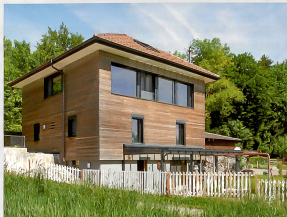
Maison avec une façade en bois. © Lutz Architectes, Givisiez

«Dans un projet de façade en bois, les critères invariables qui doivent être pris en compte sont: le niveau de sollicitation (situation, architecture), le coût, le système de traitement (plus ou moins couvrant) et la teinte, ainsi que le type de support (panneaux, lambris, profils, sens de la pose)» explique Lignum. Un planning précis devra être élaboré, qui tiendra compte de l'éventuelle mise en place d'échafaudages ou de la commande d'une couleur particulière pour un élément architectural spécifique. (Sources: Lignum, Economie suisse du