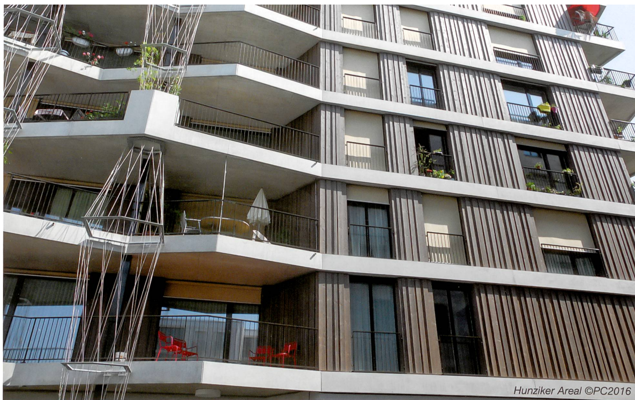
Hunziker Areal