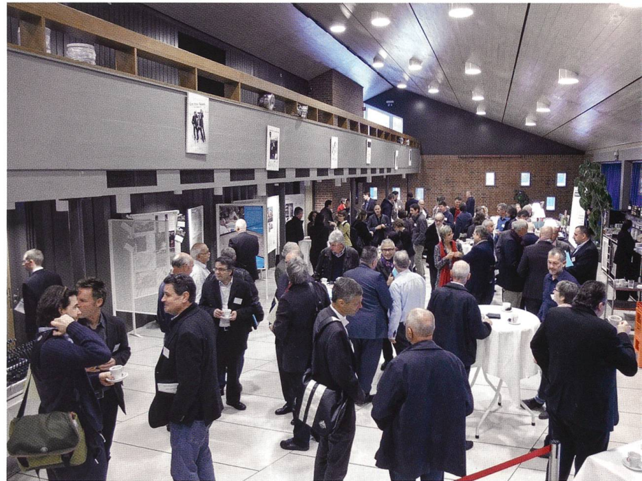
Le hall d'accueil du Parktheater lors des Journées du logement de Granges.

A l'exception du discours stéréotypé du conseiller fédéral Johann N. Schneider-Ammann, qui s'est contenté d'agrémenter d'un appel à l'innovation son éternel couplet d'un marché immobilier idéalisé (chacun a droit à une perspective d'avenir, un bon logement y contribue, le marché y pourvoit...), les différents sujets abordés étaient passionnants et ouvraient de nouveaux horizons de pensée dans le domaine de la construction de logements. Mais le moment le plus important, à défaut d'être le plus