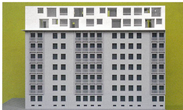
Maquette montrant le montage des éléments de façades