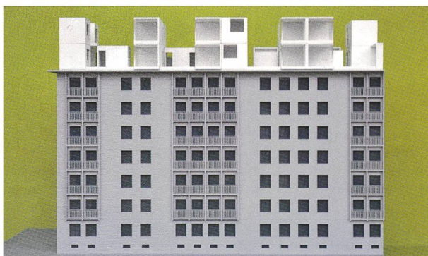
Maquette montrant le montage des modules 3D