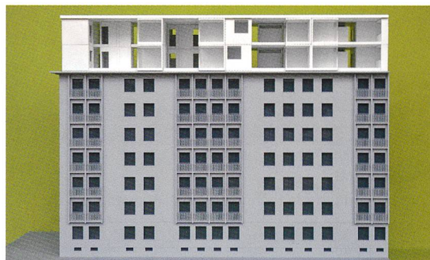
Maquette montrant le montage des éléments 2D de toiture

Cette nouvelle technique développée par les partenaires du projet de recherche «Living Shell» va donc pouvoir s'appliquer «non seulement à des rehaussements de bâtiments, mais aussi à toutes les rénovations de toitures: espaces d'habitat, espaces de travail, terrasses, jardins ou disposi-