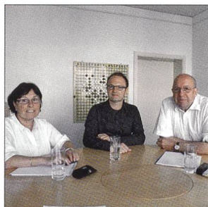
Table ronde à Bienne

Devant la lente mais permanente érosion de leur part de marché immobilier, les coopératives d'habitation et de construction biennoises montent au créneau. Avec panache et succès.