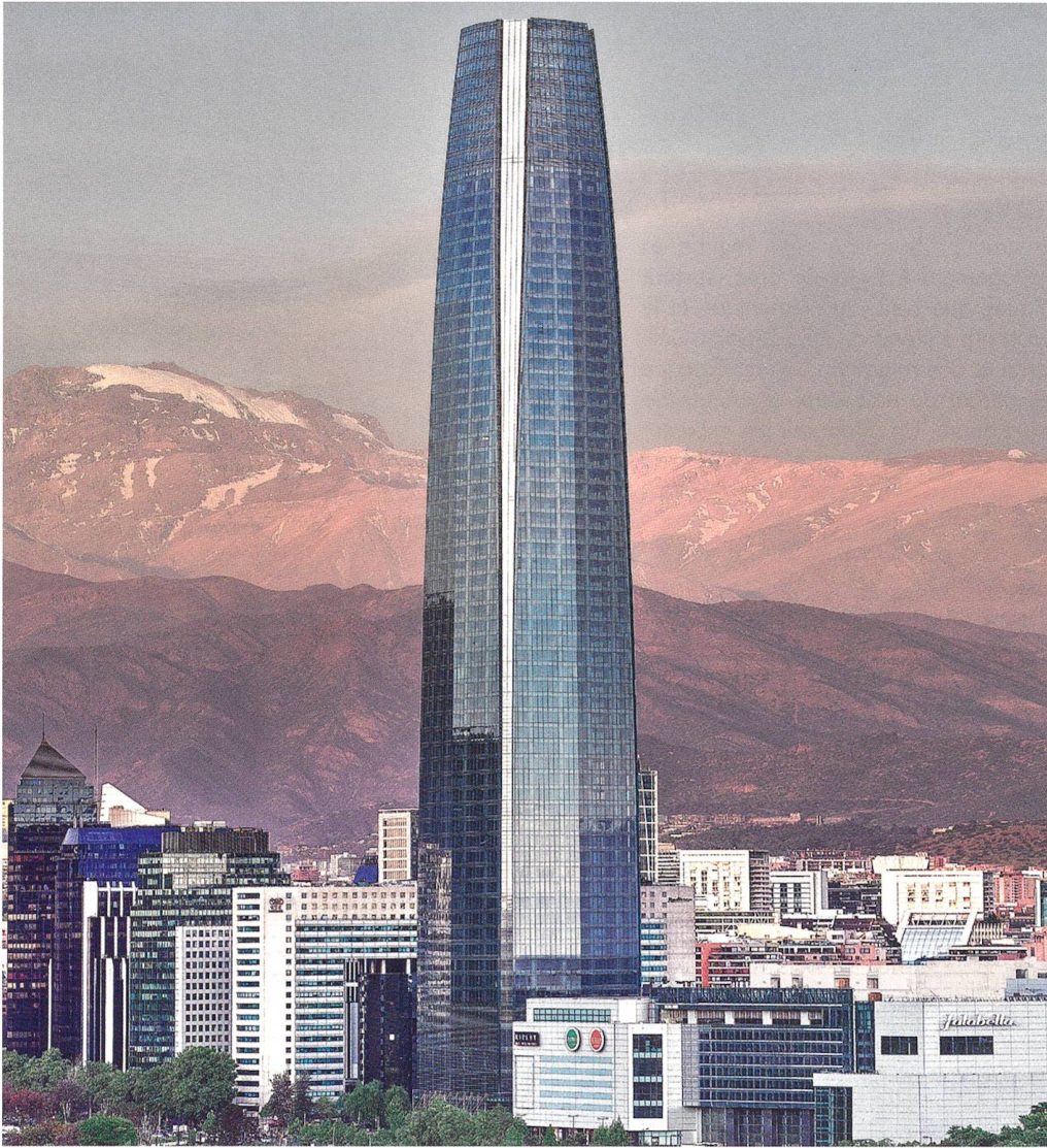
Costanera Center, Santiago, Chile