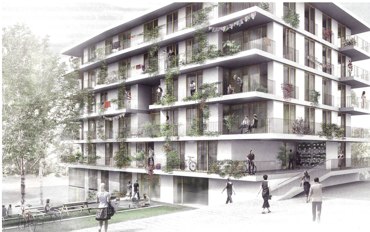
Le Fonds de solidarité a accordé un prêt relais à la Coopérative d'habitation Equilibre qui prévoit, sur trois parcelles, trois bâtiments de cinq étages abritant au total 71 logements subventionnés, dans l'écoquartier Les Vergers à Meyrin.

Des aides financières spéciales permettent aux coopératives d'habitation de construire du logement à loyer abordable. Ces aides ont été harmonisées entre elles en 2014 moyennant quelques retouches. Il est désormais possible d'utiliser des prêts pour acheter du terrain et les limitations des montants par projet et par maître d'ouvrage tombent.