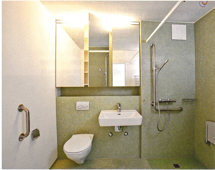
Une salle de bains adaptée après rénovation du lotissement Grünau de la Fondation pour le logement des seniors de la Ville de Zurich (SAW), avec douche sans seuil et grandes poignées pour se tenir.