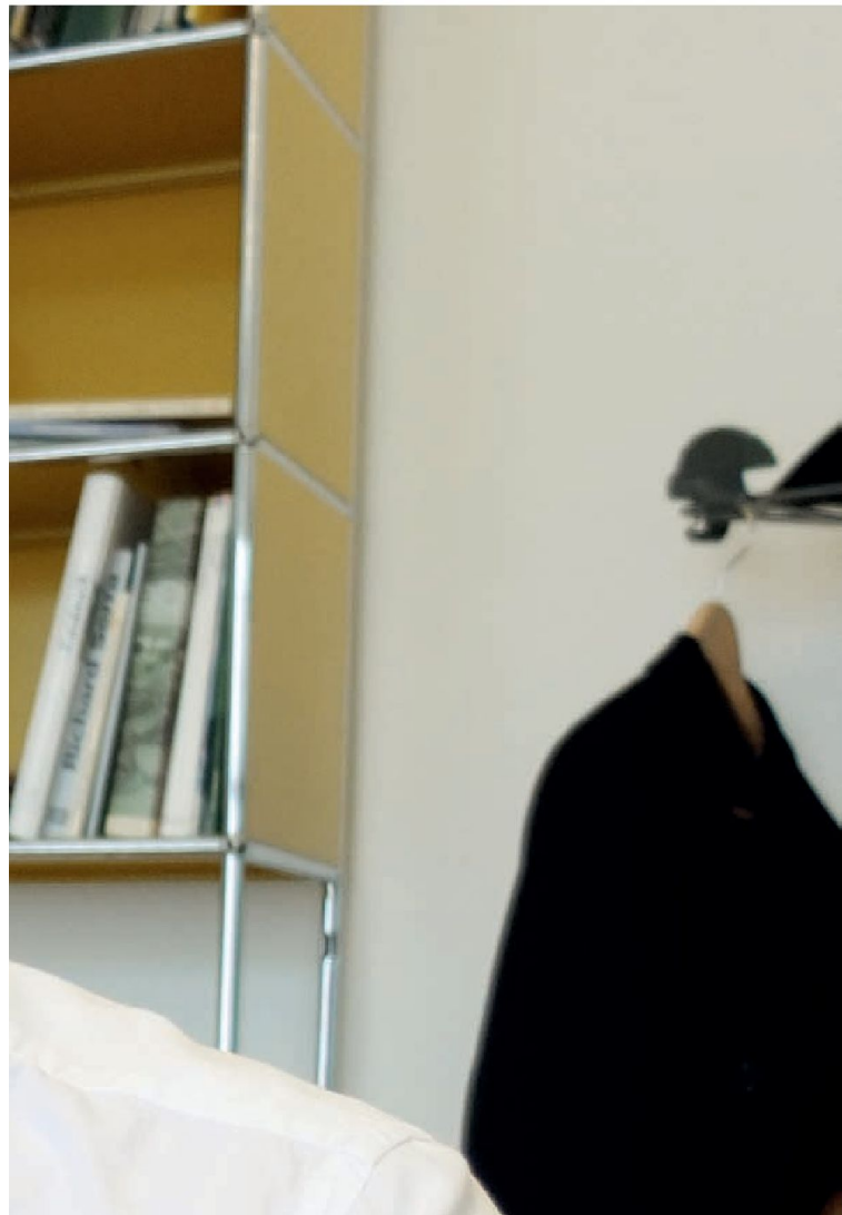
Thierry Bruttin © PC 2014