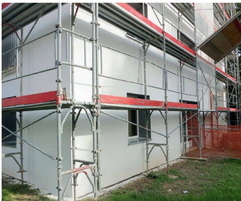
L'intervention est complétée par l'application d'un crépi fin. © Widmer architectes