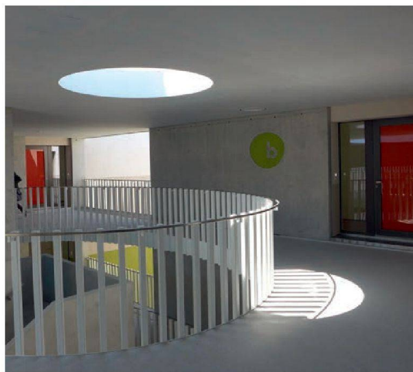
Vessy, Genève, 2013. Atelier Bonnet architectes. Maître d'ouvrage: Hospice général.