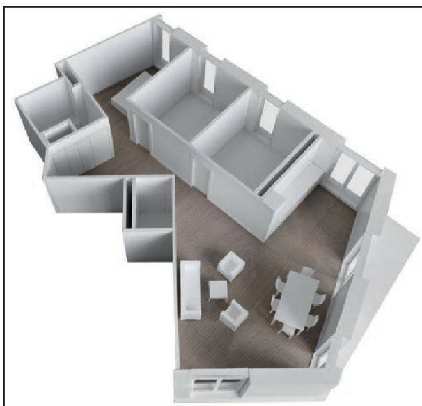
Rue Louis-Favre, Genève, Concours 2010. 1 er Prix: Jean-Paul Jaccaud architectes. Maître d'ouvrage: Fondation de la Ville de Genève pour le logement social (FVGLS).

moins d'ascenseurs et d'escaliers» (qu'un immeuble traditionnel), explique l'architecte Pierre Bonnet. Il précise, modeste, qu'une conjoncture favorable a contribué à des prix modérés de construction. Et donc de pouvoir recourir à des matériaux de meilleure qualité (planchers, fenêtres), que ceux attendus pour ce type de logement. La plateforme distributive fonctionne comme une cour et une coursive (lieux de socialisation). Son agencement offre une certaine privacité – les cheminements menant aux différents appartements ne longeant pas ceux des voisins.