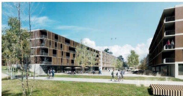
Les coopératives réaliseront une moitié des logements du grand projet des Vergers, à Meyrin.