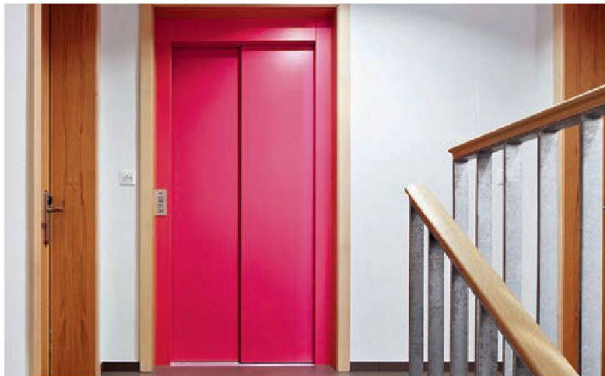
Les portes d'ascenseur de couleur rose confèrent une touche pimpante à la cage d'escalier.

Les constructions en bois sont dans l'air du temps! Une expérience partagée par les frères Adrian et Beat Schnidrig. Expérimenter les potentialités du bois, c'est une passion qu'ils ont depuis l'enfance. Le tout dernier fruit de cette passion: des immeubles avec des façades en bois de mélèze.