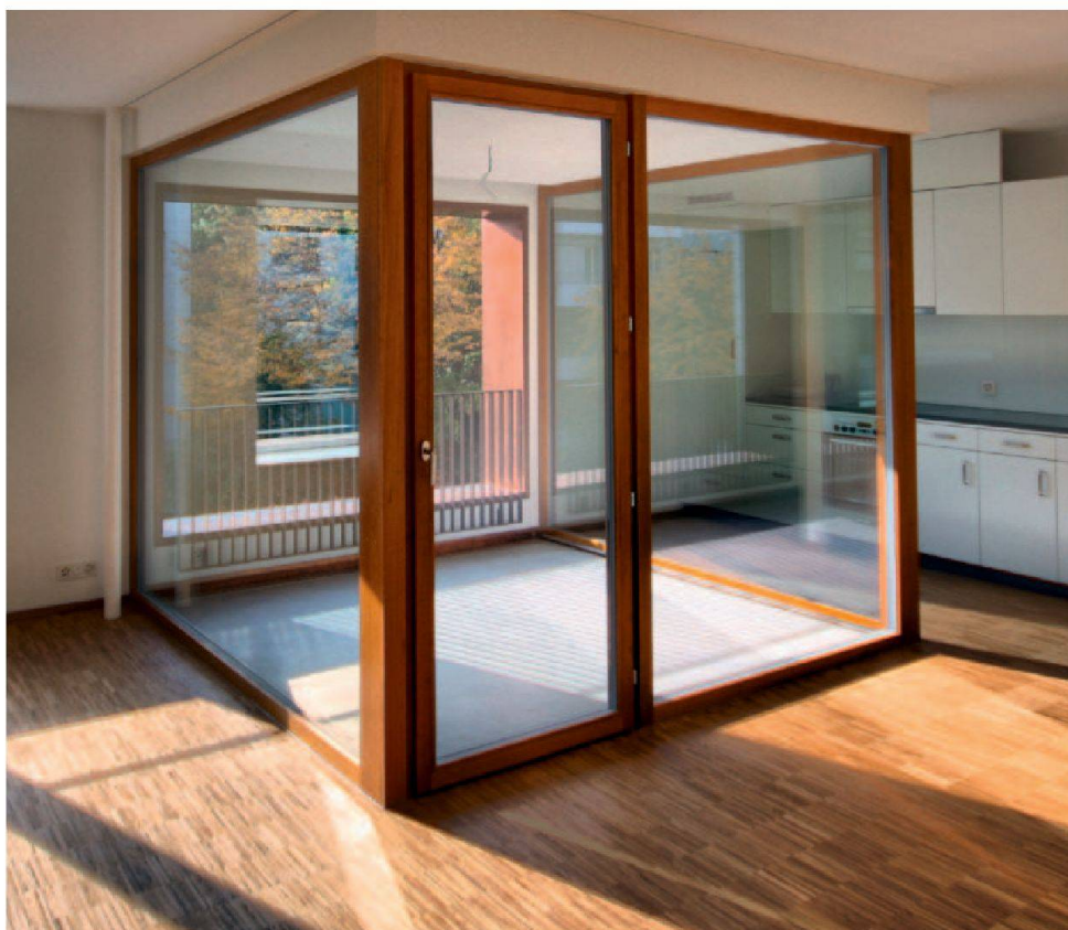
Loggia en guise de coin à manger et séjour.

Le nouvel immeuble sis à la Hegenheimerstrasse 37 compte 21 appartements en tout, ainsi que 4 salles de hobby et une salle commune. A titre d'exemple, les appartements de 3,5 pièces sont loués pour CHF 1850.- c. c., les 4,5 pièces pour 2430.-.