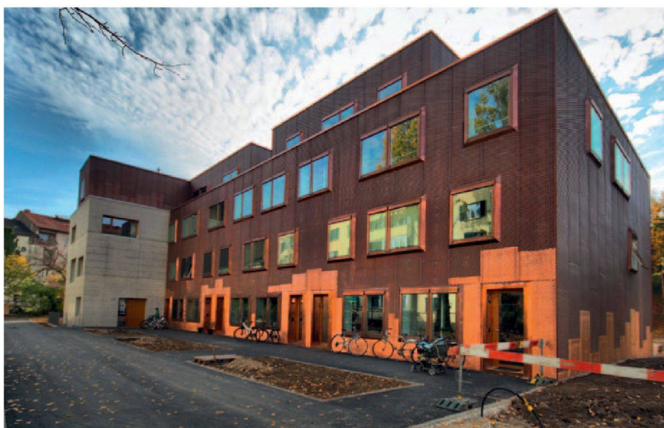
L'élégante alternance béton/cuivre de l'immeuble en T, côté cour.