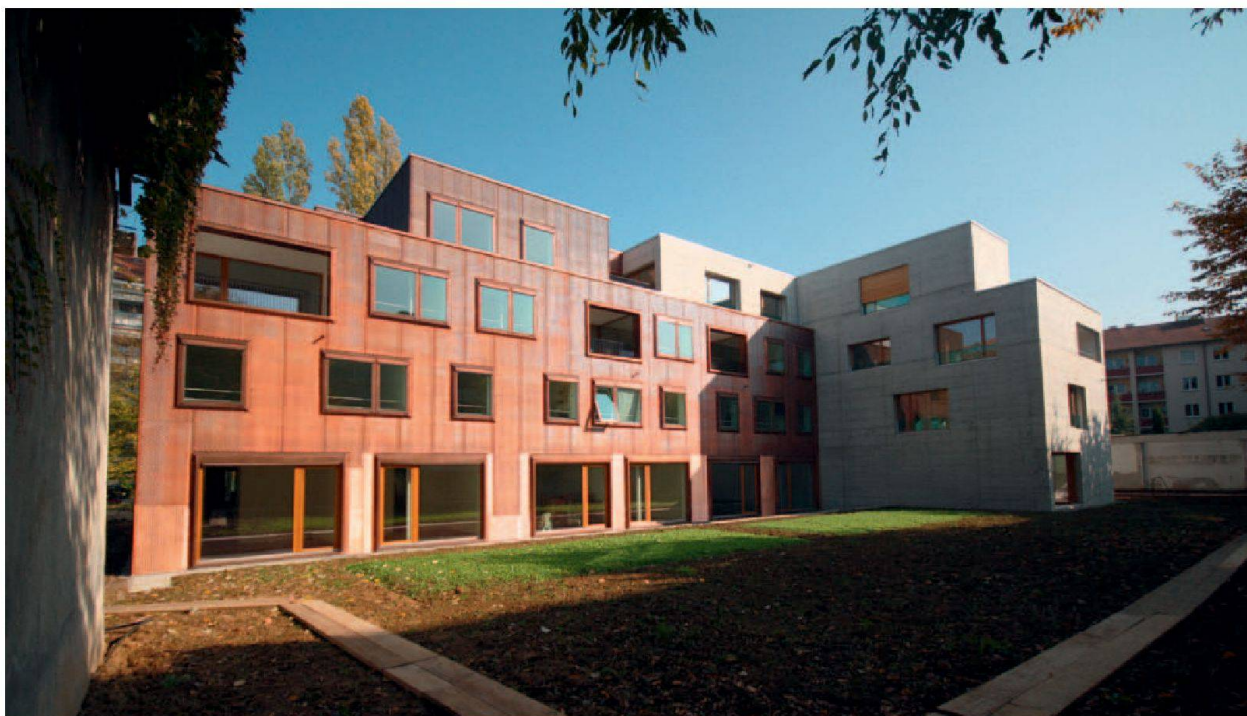
L'élégante alternance béton/cuivre de l'immeuble en T, côté jardin.

accès privé à la cour intérieure sans trafic. De l'autre côté de l'immeuble, elles bénéficient d'une petite place et d'un accès direct au jardin, où les enfants ont l'immense privilège de pouvoir s'ébattre librement... en pleine ville. Une unique cage d'escaliers implantée dans la partie en béton du bâtiment donne accès aux quinze autres appartements. Tandis que les appartements du rez ont un accès direct à ce jardin qui ressemble à un parc, les appartements en attique offrent une vue de rêve sur la ville de Bâle. Et comme l'immeuble lui-même se trouve à l'intérieur d'une cour, les habitants jouissent d'un environnement protégé et calme, en plein milieu urbain.