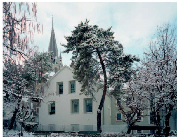
Les façades côté cour avant et après rénovation. © aas, © Silvio Do Nascimento