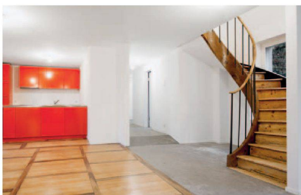
Vue avant/après de la cuisine et de l'escalier au 3 e étage, dans le duplex de Curtat 20.

habitants – la plupart ont la quarantaine – a rendu ce processus participatif plus facile à concrétiser. L'un des habitants-coopérateurs est une dame retraitée, et elle s'est tout à fait bien adaptée à ce mode de faire.