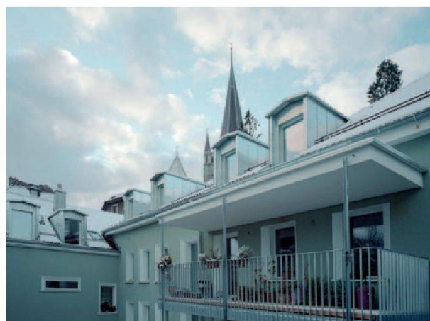
Vue de la cour intérieure commune de la rue Curtat 20 et 22, avant et après.

à conserver le charme et l'atmosphère de ce quartier de la Cité! En plus, il fallait faire ces travaux de réfection dans un ordre logique afin d'éviter toute complication technique. Un planning précis et difficile fut donc élaboré.