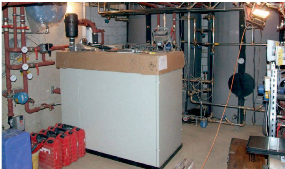
Vue de la salle technique avec au centre le bloc de cogénération.

Pour en apprendre davantage sur la domotique: www.domo-energie.com