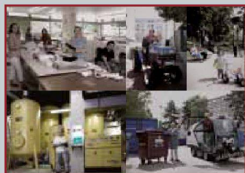
De gauche à droite: Buanderie et chaufferie, SCHG, Genève; SCH Les Ailes, Grand-Saconnex; place de jeux et déchetterie, FLCL, Lau- sanne.