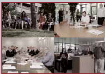
De gauche à droite: FLCL, Lausanne; Comité ASH romande, Lausanne; secréta- riat ASH romande, Lausanne; secrétariat SCHL, Lausanne.