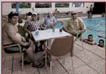
Piscine SCH Les Ailes, Genève-Cointrin.