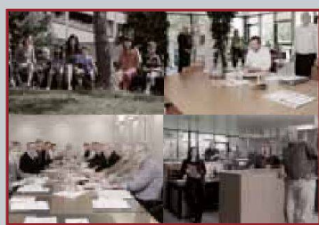
De gauche à droite: FLCL, Lausanne; Comité ASH romande, Lausanne; secréta- riat ASH romande, Lausanne; secrétariat SCHL, Lausanne.