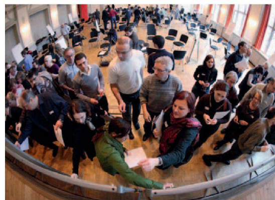
Projet urbain à Yverdon-les-Bains.

Une expérience pilote ne se suffit pas à elle-même; elle a l'ambition de vérifier par l'expérimentation le bien-fondé ou les résultats d'une approche. Le programme veut bien sûr développer sa démarche, optimiser les résultats, démontrer son utilité, rendre ce mode de travail attractif aux yeux des communes. Il veut promouvoir l'idée qu'à travers une action intégrale et territorialisée, il est possible de traiter les méfaits de la ségrégation spatiale qui, elle, est toujours plus présente au sein de nos agglomérations. Qu'il ne s'agit pas de «réparer» des territoires défailants par des opérations-chocs, le plus souvent aux frais des habitants en place, mais de les développer en partant de leur génie propre, en travaillant avec leurs forces vives et en plaçant les habitants au centre des