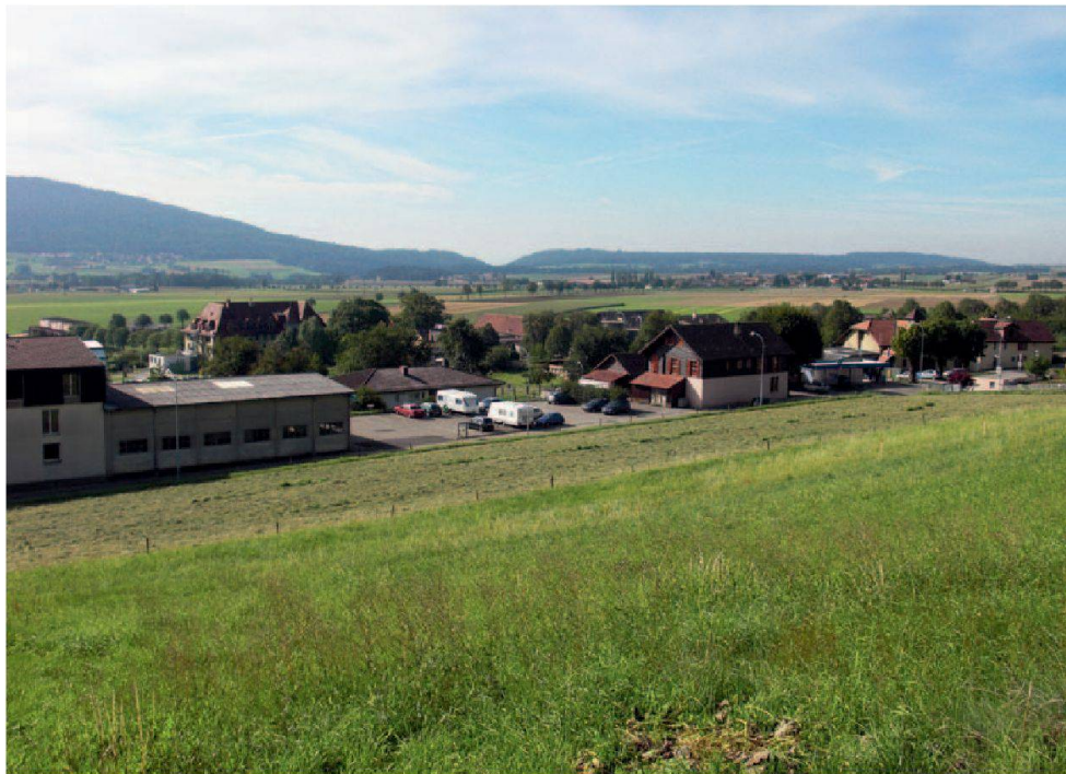
Le champ qui accueillera les 56 logements de la coopérative Les Héliotropes.

Ce projet a pu se concrétiser grâce à un partenariat public-privé. L'Etat de Neuchâtel a octroyé un DDP gratuit durant 15 ans mais s'est également engagé financièrement par l'acqui-