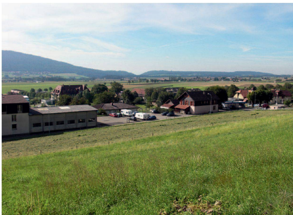
Le champ qui accueillera les 56 logements de la coopérative Les Héliotropes.

Ce projet a pu se concrétiser grâce à un partenariat public-privé. L'Etat de Neuchâtel a octroyé un DDP gratuit durant 15 ans mais s'est également engagé financièrement par l'acqui-