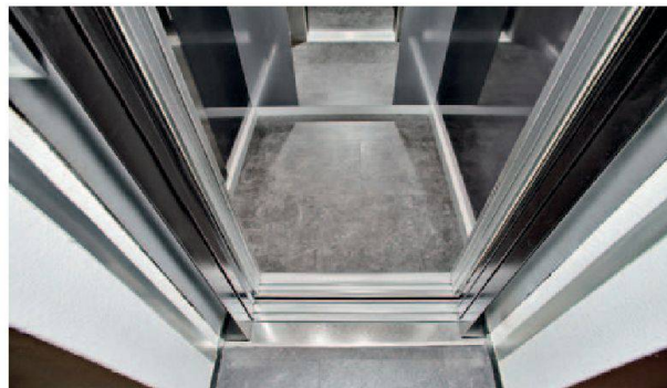
Une transition parfaite: le revêtement linoléum gris en version métallique est identique au sol des étages supérieurs.

Les neuf anciens ascenseurs, qui ne répondaient plus aux consignes de sécurité actuelles, ont tous été remplacés par de nouveaux ascenseurs. On a installé des modèles VarioStar Plus qui se sont parfaitement intégrés dans le projet. «Le VarioStar Plus s'intègre rapidement dans les cages d'ascenseurs existantes; par ailleurs, il séduit par sa consommation d'énergie très faible», explique Manuel Cordeiro, responsable des ventes du secteur modernisation chez AS Ascenseurs Lausanne.