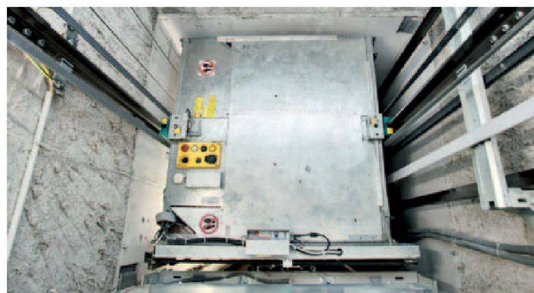
La cabine aux dimensions maximisées s'adapte parfaitement à la cage d'ascenseur actuelle.