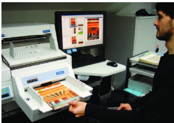
Le scannage automatique des pages détachées de la revue.