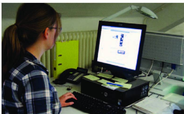
La saisie des métadonnées pertinentes.

d'image – ce qui fait qu'au final, certaines pages visibles sur le Net sont en bien meilleur état que les originaux!