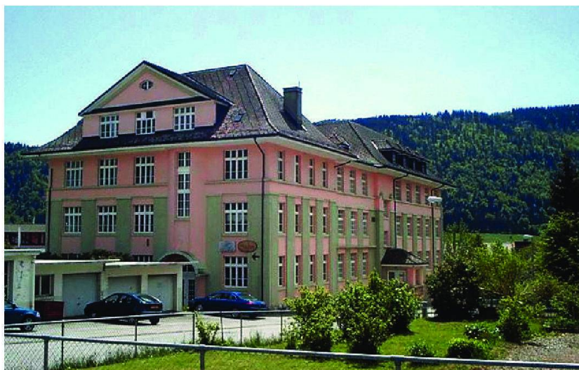
Le bâtiment de l'ancienne manufacture de harpes est en excellent état.

Cette option sociale se retrouve dans les démarches entreprises pour abriter, sur les 600 m 2 du rez-de-chaussée supérieur du bâtiment, un centre de vie enfantine. Fin octobre,