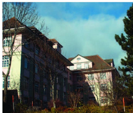
L'immeuble en forme de L offre 1600 m² de surface utile.

Ecologie sociale, mais aussi énergétique. Le bâtiment est en bon état, et même aux normes antisismiques. Mais il est vide, toutes les cloisons intérieures et la tuyauterie doivent être construites ou installées. «Légalement, nous pourrions procéder à