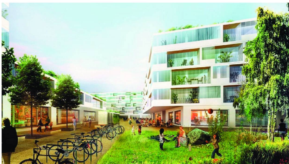
Après de très importants travaux de dépollution, le site de la Jonction accueillera un éco-quartier de 260 hectares. Le projet primé accorde une grande importance à la mobilité douce et favorise la mixité des activités.